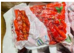
Ớt tươi đông lạnh 250g/túi 730y/kg