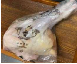
Gà dai loại ngon ~1kg Kiện 26 con 420y/con