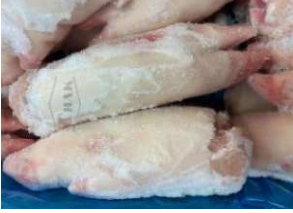
Móng heo nguyên cái nguyên thùng 豚足