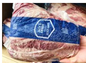
Bắp bò XANH (Úc) - Nguyên bắp 【オーストラリア産】牛スネ