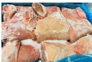
Bắp heo có da xương - Nguyên thùng 皮・骨付き豚スネ