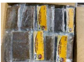
Cua đồng xay 200g/túi カニのピューレ 200y/túi