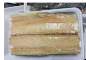
Cá thu phi lê đóng khay さわらフィレー 2,500y/kg