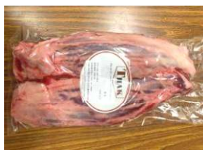
Bắp bò - LỖI HOA 牛スネ (選択品)