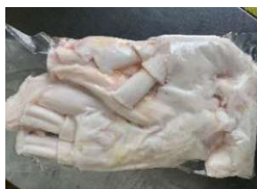
Gân bò trắng - Túi CK ~1kg 牛アキレス