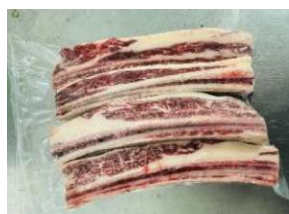
Sườn bò cắt dọc - Túi CK 牛リブ (カット)