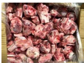
Xương ống heo nguyên thùng 豚骨 (カット)