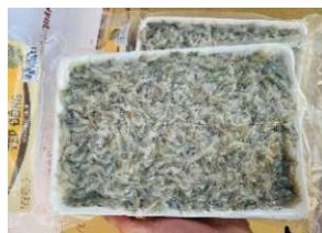
Tép đồng 450g/khay 小エビ 450y/khay