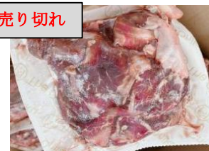
Gân bò có thịt túi 500g 肉付き牛すじ