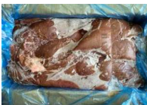
Gan heo nguyên thùng 豚レバー