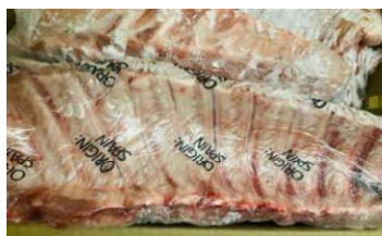
Sườn già nguyên miếng 豚スペアリブ