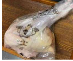
Gà dai loại ngon ~1,2kg Kiện 20 con 490y/con