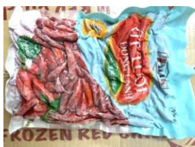
Ớt tươi đông lạnh 500g/túi 720y/kg