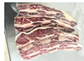
Sườn bò cắt ngang 2cm - Túi CK 牛リブ (カット)