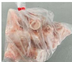
Xương ống heo túi thường ~1kg 豚骨 (カット)