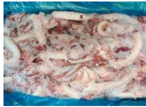
Cuồng họng nguyên thùng 豚ノド