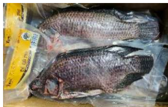
Cá rô phi nguyên con ティラピア魚 670y/kg