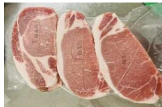
Cốt lết không xương cắt lát túi CK 豚ロース (骨なし) スライス