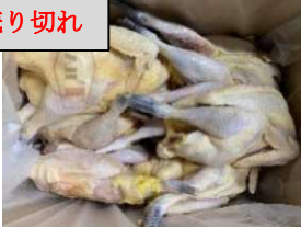
Gà chân đen Nagoya Cochin Kiện 18 con 1,120y/con