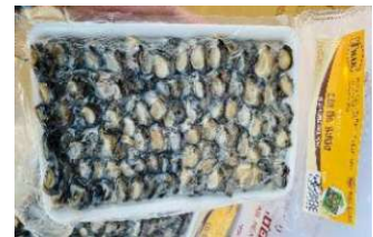
Cò ốc bươu 450g/khay カタツムリ 400y/khay