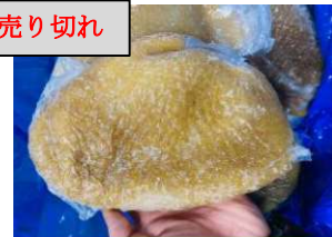
Tổ ong bò làm sạch - Túi CK ~1kg 牛ハチノス 1,020y/kg