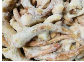
Đuôi heo nguyên thùng 豚テール