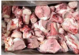
Xương ống bò cắt sẵn 牛骨 (カット) 380y/kg