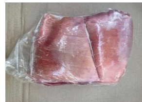
Bắp heo RÚT XƯƠNG túi CK 皮付き豚スネ (骨なし)