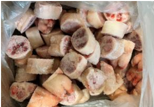
Móng heo cắt khoanh chưa đóng túi 豚足 (輪切)