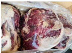
Nạc mông bò Úc 【オーストラリア産】牛ウチモモ 1,780y/kg