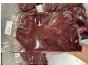
Gan heo túi CK ~1kg 豚レバー