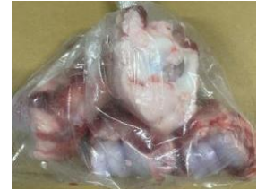
Xương ống bò cắt sẵn túi thường ~1kg 牛骨 (カット) 430y/kg