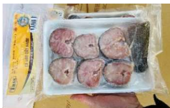
Cá lóc cắt khúc 450g/khay ライギョ魚カット 430y/khay