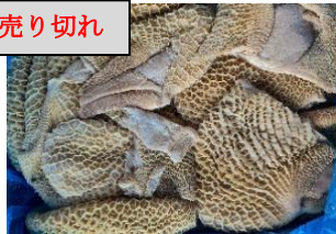
Tổ ong bò làm sạch - Nguyên thùng 牛ハチノス 950y/kg