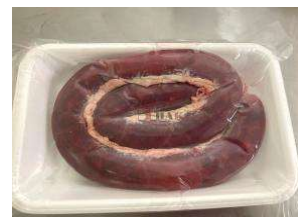
Lòng tiết (400~500g/khay) 1,499y/kg