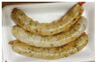
Dòi sụn chiên sẵn (~500g/khay) 1,700y/kg