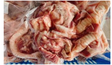
Cuồng họng túi CK ~1kg 豚ノド