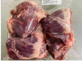
Tim heo túi CK ~1kg 豚ハツ