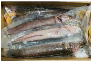
Cá lóc làm sạch nguyên con (có đầu) ライギョ魚 850y/kg