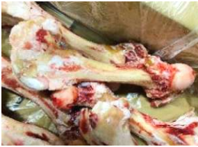
Xương ống bò chưa cắt 牛骨 340y/kg