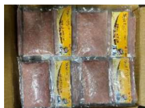
Chả cá thác lát 200g/túi ナイフフィッシュのすり身 320y/túi