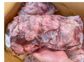
Diềm heo túi CK ~1kg 豚ハラミ