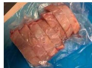
Bắp heo có da xương cắt khoanh - Túi CK 皮・骨付き豚スネ (スライス)