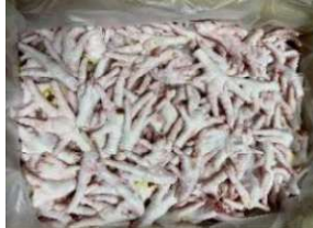
Chân gà ngắn nguyên thùng 鶏ショートモミジ 240y/kg