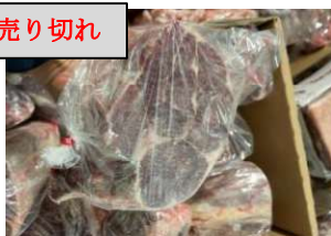
Bắp bò Hà Lan - Cắt, túi thường 【ポーランド産】牛スネ