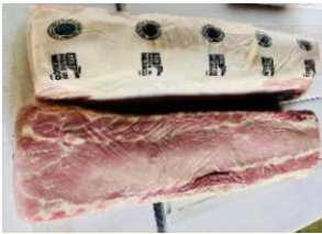
Cốt lết không xương nguyên tảng 豚ロース (骨なし)