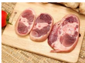
Bắp heo có da xương cắt khoanh 皮・骨付き豚スネ (スライス)