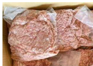
Thịt heo xay 豚ミンチ