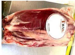
Bắp bò - Túi CK ~1kg 牛スネ 1,400y/kg