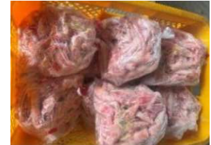
Chân gà ngắn túi thường ~1kg 鶏ショートモミジ 290y/kg