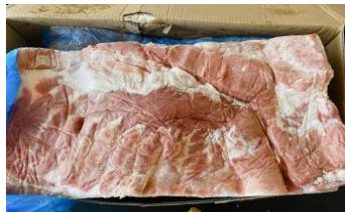
Ba chỉ không da nguyên tảng 豚バラ (皮・骨抜き)