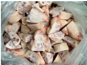
Móng heo cắt nhỏ chưa đóng túi 豚足 (六分カット)