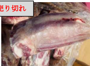
Bắp bò Hà Lan - Nguyên bắp 【ポーランド産】牛スネ