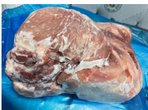
Mông heo nguyên tảng 豚モモ