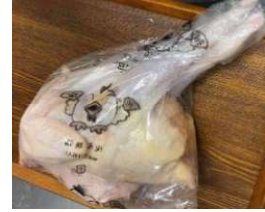
Gà dai loại ngon ~1,4kg Kiện 16 con 569y/con