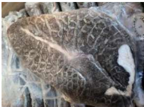
Tổ ong bò đen 牛ハチノス (黒) 780y/kg