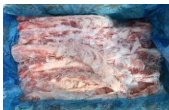
Sườn non nguyên thùng 豚軟骨