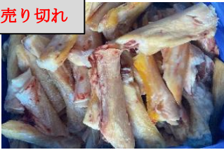
Gân bắp bò nguyên thùng 牛アキレス腱 750y/kg