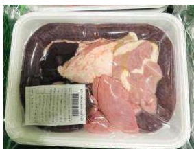
Set lòng dòi sống (~500g/khay) 599y/khay