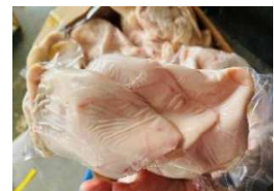
Tai heo túi CK ~1kg 豚ミミ