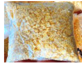
Khoai mì xay sẵn túi 1kg 冷凍挽きキャッサバ 800y/kg