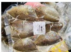
Cá giò biển ướp muối ớt túi ~500g 1,250 980y/kg