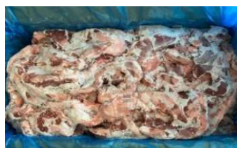
Diềm heo nguyên thùng 豚ハラミ