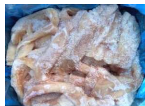
Gân bò trắng nguyên thùng 牛アキレス