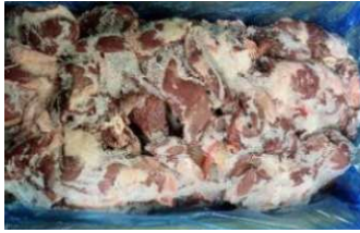
Tim heo nguyên thùng 豚ハツ