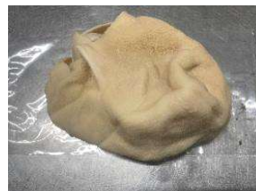
Tổ ong/ Sách dê ヤギの胃腸 790 650y/kg