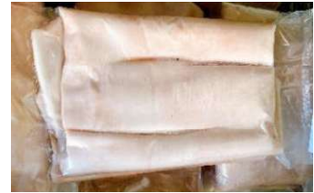
Da heo loại A túi CK ~1kg 豚皮