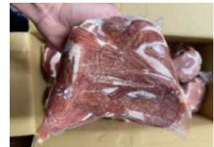
Lòng non sạch cứng túi thường 脂肪抜き豚小腸