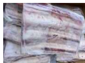
Sườn bò - Nguyên tảng 牛リブ