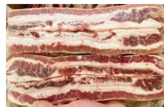
Ba chỉ bò - Túi CK 牛バラ