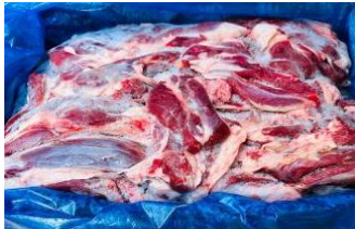
Bắp bò Úc loại 1 nguyên thùng 27.2kg 【オーストラリア産】牛スネ 1,350y/kg