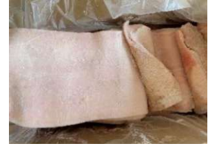
Da heo loại A nguyên thùng 豚皮