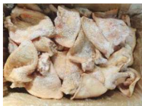
Tai heo nguyên thùng 豚ミミ