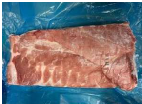
Ba chỉ da nguyên tảng 皮付き豚バラ (骨なし)