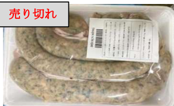
Dòi sụn sống (~400g/khay) 1,600y/kg