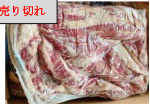
Diềm bò (harami/ sagari) 牛ハラミ 1,590y/kg