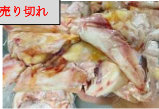
Gân bắp bò - Túi CK ~1kg 牛アキレス腱 770y/kg