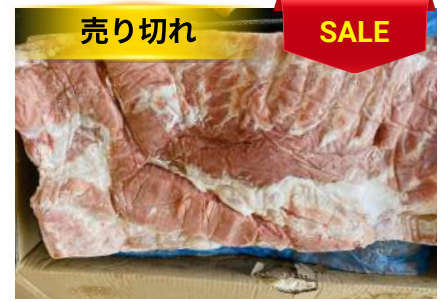
Ba chỉ không da nguyên tảng 豚バラ (皮・骨抜き)