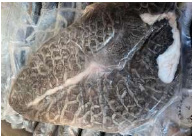
Tổ ong bò đen 牛ハチノス (黒)