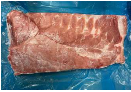
Ba chỉ da nguyên tảng 皮付き豚バラ (骨なし)