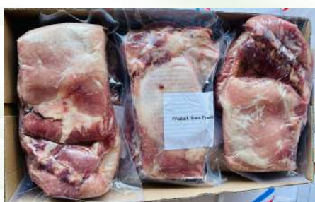
Sườn già nguyên miếng 豚スペアリブ