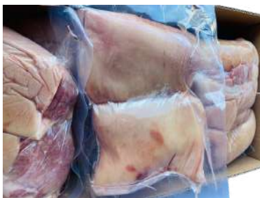
Bắp heo RÚT XƯƠNG túi CK 皮付き豚スネ (骨なし)