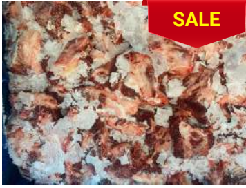
Thịt đầu bò nguyên thùng ぎゅうとうにく