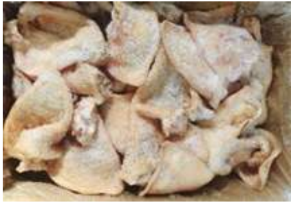
Tai heo nguyên thùng 豚ミミ