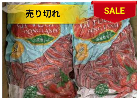
Ớt đỏ đông lạnh 500g/túi