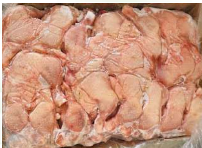
Đùi gà nguyên thùng 鶏モモ