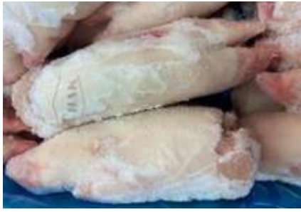
Móng heo nguyên cái nguyên thùng 豚足