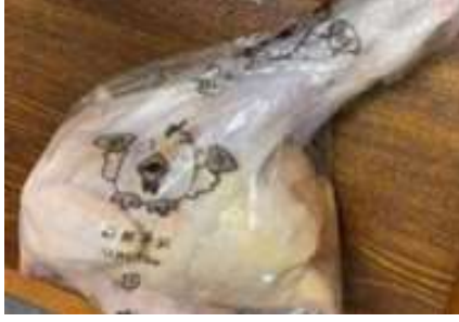
Gà dai loại ngon ~ 1kg Kịch 26 con