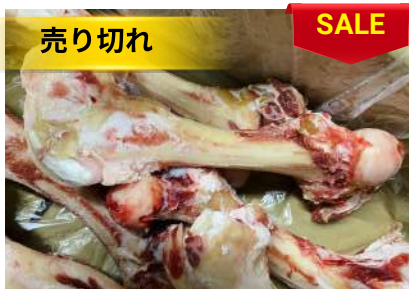
Xương ống bò chưa cắt 牛骨