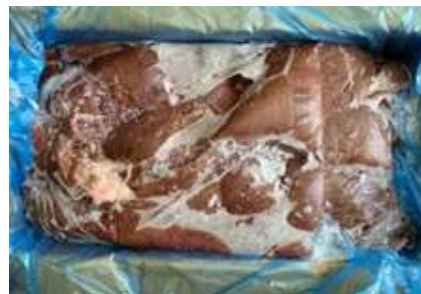
Gan heo nguyên thùng 豚レバー