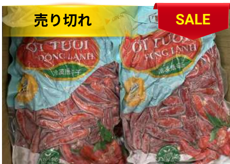
Ớt tươi đông lạnh 250g/túi

100% organic, không hóa chất Bảo quản đông lạnh giữ trọn vị Vị cay thơm chuẩn vị Tiện lợi mọi lúc, mọi nơi