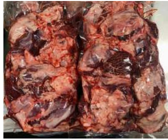
Thịt đầu bò - Túi CK ~1kg ぎゅうとうにく