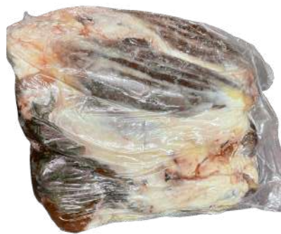
Bắp bò - Nguyên Bắp ~ 4kg シャンクミート