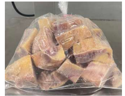
Gà dai loại ngon cắt sẵn nửa con (~1kg/con)