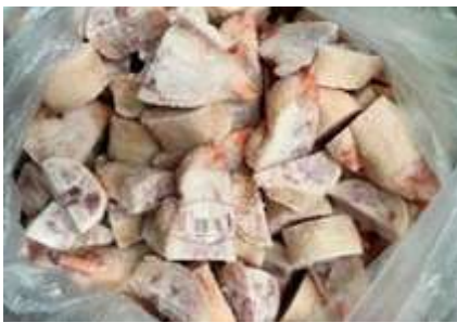
Móng heo cắt nhỏ chưa đóng túi 豚足 (六分カット)