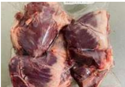
Tim heo túi CK ~1kg 豚ハツ