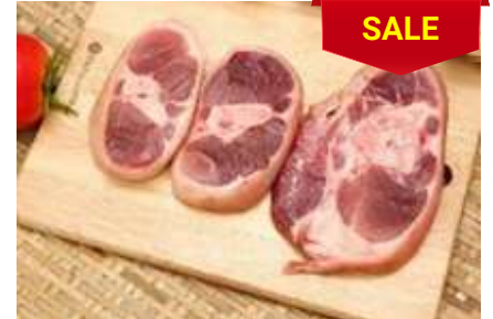
Bắp heo có da xương cắt khoanh 皮・骨付き豚スネ (スライス)