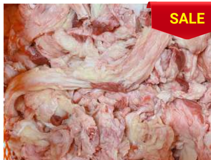
Gân mỡ bắp bò - CK ~1kg 牛すね肉のスジと脂