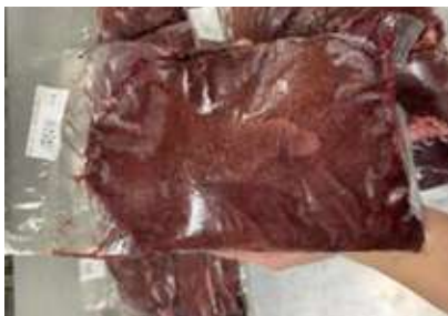
Gan heo túi CK ~1kg 豚レバー