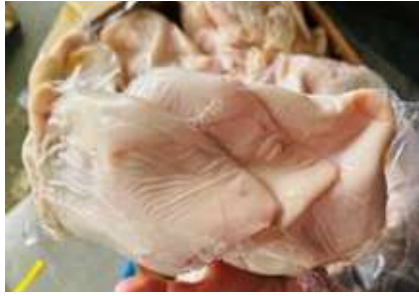
Tai heo túi CK ~1kg 豚ミミ