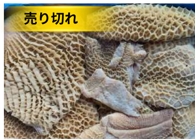
Tổ ong bò làm sạch - Nguyên thùng 牛ハチノス