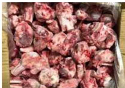
Xương ống heo nguyên thùng 豚骨 (カット)