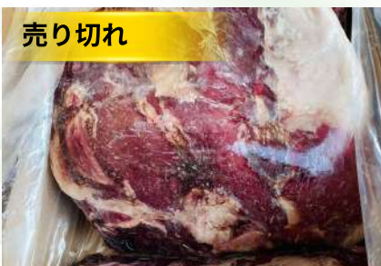
Nạc mông bò Úc 【オーストラリア産】牛ウチモモ