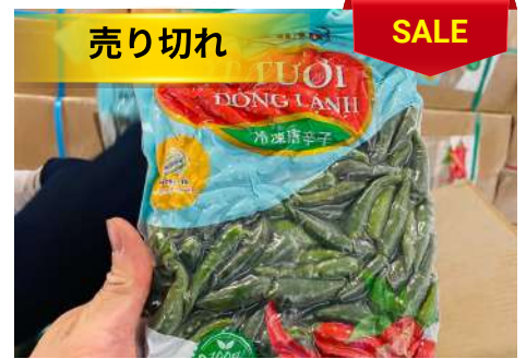
Ớt Xanh đông lạnh 500g/túi