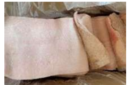
Da heo loại A nguyên thùng 豚皮