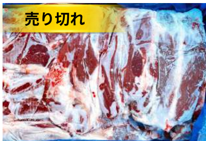
Bắp bò Úc loại 1 nguyên thùng 【オーストラリア産】牛スネ