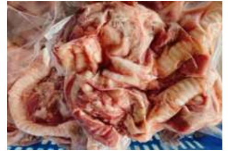
Cuống họng túi CK ~1kg 豚ノド