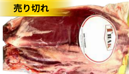
Bắp bò - Túi CK ~1kg 牛スネ