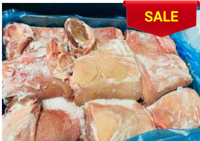
Bắp heo có da xương - Nguyên thùng 皮・骨付き豚スネ