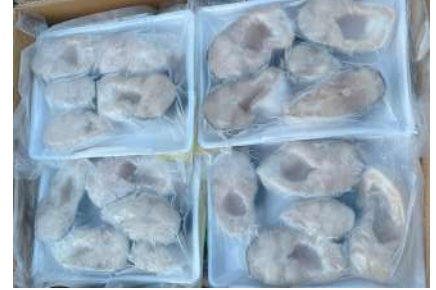
Cá ba sa cắt khúc 500g/khay バス魚 カット