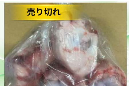
Xương ống bò cắt sẵn túi thường ~1kg 牛骨 (カット)