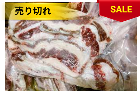
Ba chỉ bò - Túi CK 牛バラ