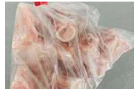
Xương ống heo túi thường ~1kg 豚骨 (カット)