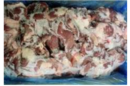
Tim heo nguyên thùng 豚ハツ