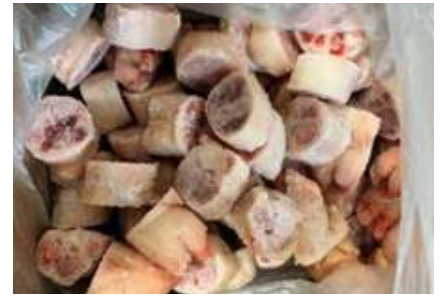
Móng heo cắt khoanh chưa đóng túi 豚足 (輪切)