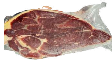
Bắp bò - Túi CK ~ 1kg 牛スネ