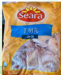
Cánh gà nguyên thùng 鶏手羽