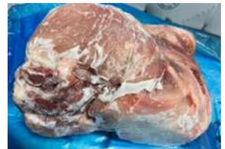
Mông heo có da nguyên tảng 豚モモ 皮付き