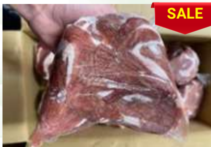
Lòng non sạch cứng túi thường 脂肪抜き豚小腸