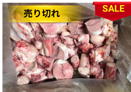
Xương ống bò cắt sẵn 牛骨 (カット)