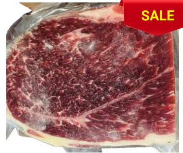
Nạm gầu bò - Túi CK ~ 1KG クロッド