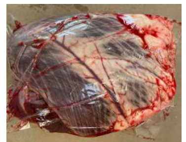
Tim bò - Túi CK ~1kg 牛ハツ (ぎゅうハツ)