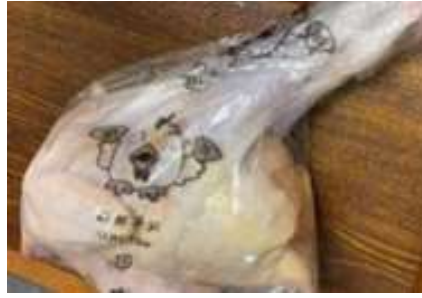
Gà dai loại ngon ~ 1,2kg Kịch 20 con