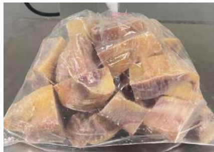
Gà dai loại ngon cắt sẵn nguyên con (~1kg/con)