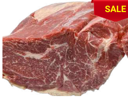
Nạm gầu bò nguyên tảng クロッド