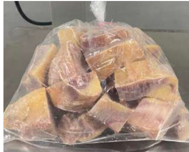
Gà dai loại ngon cắt sẵn nửa con (~1.2kg/con)