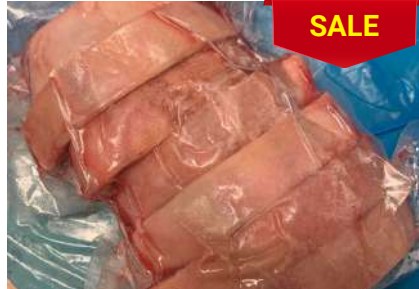
Bắp heo có da xương cắt khoanh - CK 皮・骨付き豚スネ (スライス)