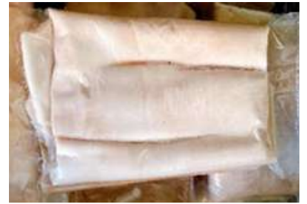
Da heo loại A túi CK ~ 1kg 豚足 (六分カット)