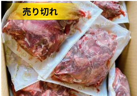
Gân bò có thịt túi 500g 肉付き牛すじ