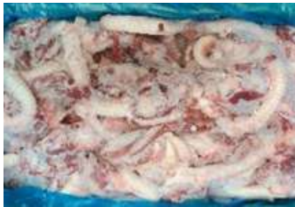
Cuống họng nguyên thùng 豚ノド