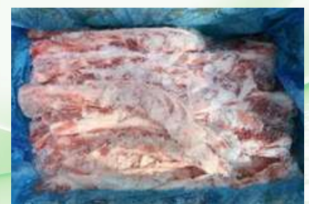
Sườn non nguyên thùng 豚軟骨