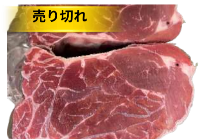
Bắp bò - LỖI HOA 牛スネ(選択品)