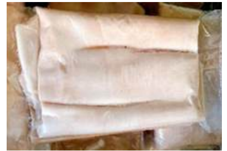
Da heo loại A túi CK ~ 1kg 豚足 (六分カット)