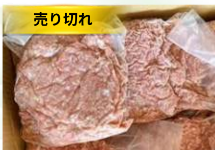
Thịt heo xay 豚ミンチ