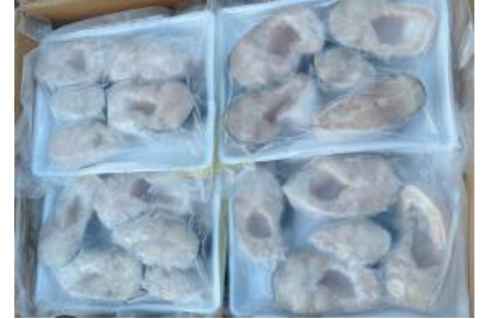
Cá ba sa cắt khúc 500g/khay バス魚 カット