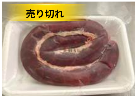
Lòng tiết (400~500g/khay)