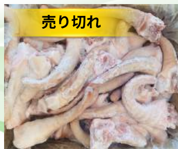
Đuôi heo nguyên thùng 豚テール