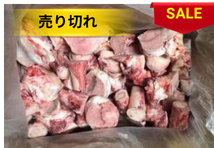
Xương ống bò cắt sẵn 牛骨 (カット)