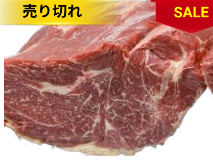
Nạm gầu bò nguyên tảng クロッド