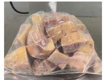
Gà dai loại ngon cắt sẵn nửa con (~1kg/con)