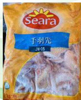
Cánh gà nguyên thùng 鶏手羽