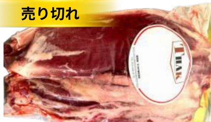
Bắp bò - Túi CK ~1kg 牛スネ