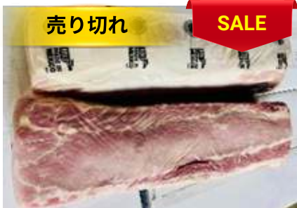
Cốt lết không xương nguyên tảng 豚ロース (骨なし)