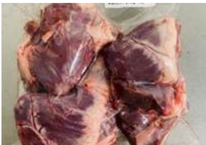
Tim heo túi CK ~1kg 豚ハツ