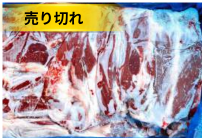
Bắp bò Úc loại 1 nguyên thùng 【オーストラリア産】牛スネ