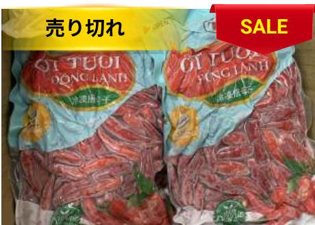
Ớt tươi đông lạnh 250g/túi

100% organic, không hóa chất Bảo quản đông lạnh giữ trọn vị Vị cay thơm chuẩn vị Tiện lợi mọi lúc, mọi nơi