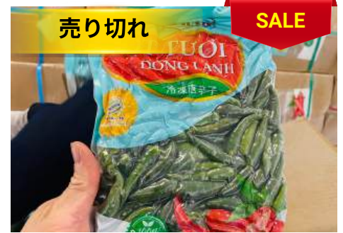
Ớt Xanh đông lạnh 500g/túi