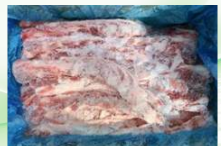
Sườn non nguyên thùng 豚軟骨