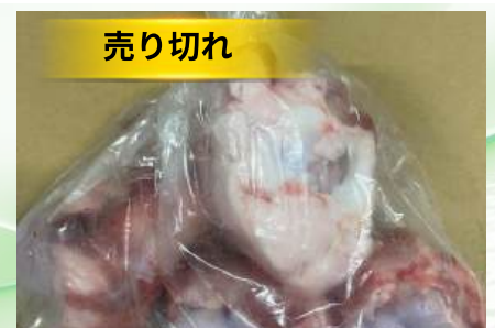
Xương ống bò cắt sẵn túi thường ~1kg 牛骨 (カット)