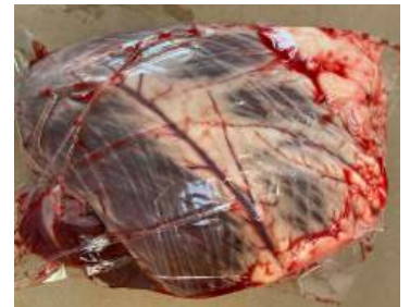
Tim bò - Túi CK ~1kg 牛ハツ (ぎゅうハツ)