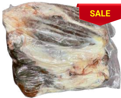
Bắp bò - Nguyên Bắp ~ 4kg シャンクミート