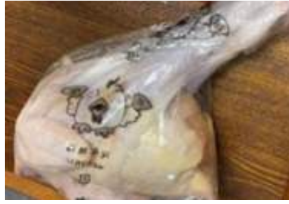
Gà dai loại ngon ~ 1,2kg Kịch 20 con