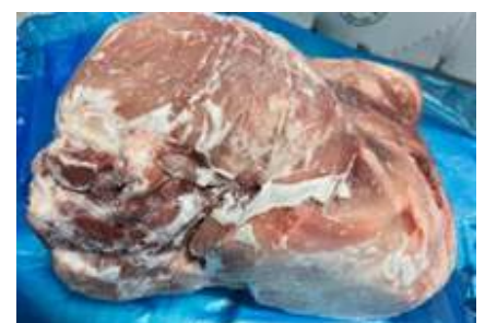
Mông heo có da nguyên tảng 豚モモ 皮付き