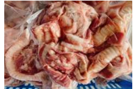
Cuống họng túi CK ~1kg 豚ノド