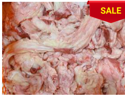
Gân mỡ bắp bò - CK ~1kg 牛すね肉のスジと脂