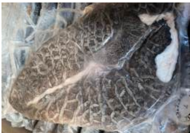
Tổ ong bò đen 牛ハチノス (黒)