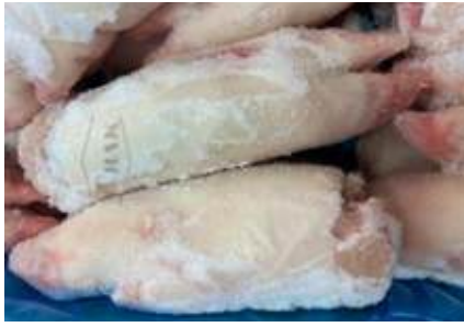
Móng heo nguyên cái nguyên thùng 豚足