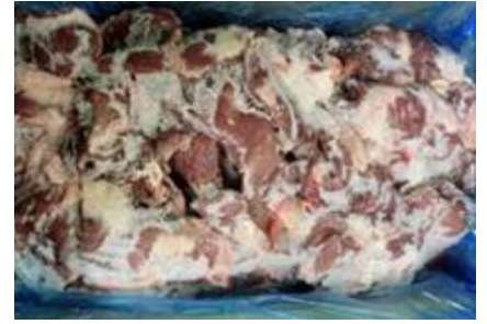
Tim heo nguyên thùng 豚ハツ