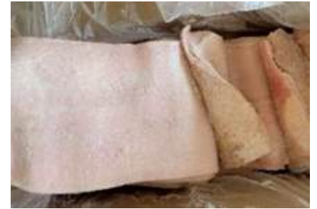
Da heo loại A nguyên thùng 豚皮