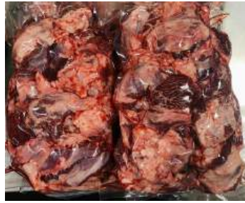
Thịt đầu bò - Túi CK ~1kg ぎゅうとうにく