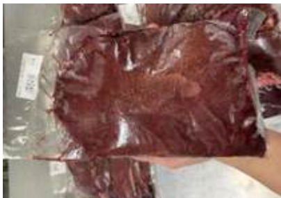
Gan heo túi CK ~1kg 豚レバー