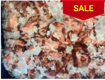
Thịt đầu bò nguyên thùng ぎゅうとうにく