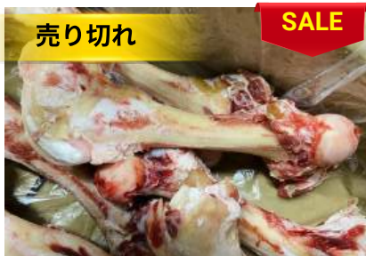
Xương ống bò chưa cắt 牛骨