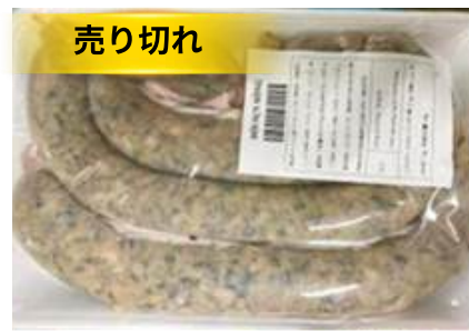
Dồi sụn sống (~400g/khay)