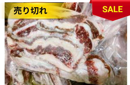
Ba chỉ bò - Túi CK 牛バラ