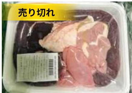
Set lòng dôi sống (~1kg/khay)