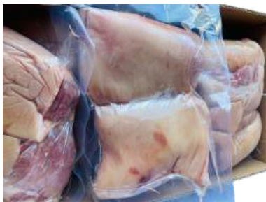
Bắp heo RÚT XƯƠNG túi CK 皮付き豚スネ (骨なし)