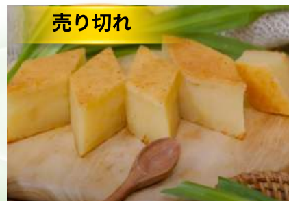
Bánh khoai mì nướng (túi 500g)