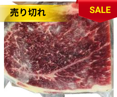
Nạm gầu bò - Túi CK ~ 1KG クロッド