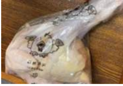
Gà dai loại ngon ~ 1kg Kịch 26 con