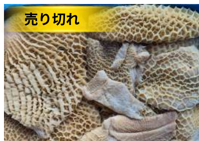
Tổ ong bò làm sạch - Nguyên thùng 牛ハチノス