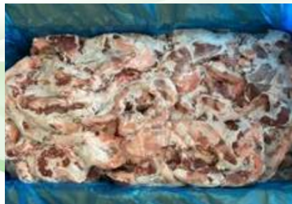
Diêm heo nguyên thùng 豚ハラミ