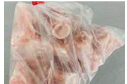
Xương ống heo túi thường ~1kg 豚骨 (カット)