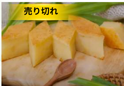
Bánh khoai mì nướng (túi 1kg)