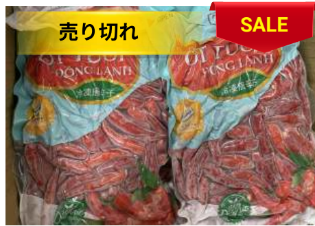
Ớt đỏ đông lạnh 500g/túi