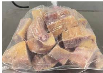
Gà dai loại ngon cắt sẵn nguyên con (~1kg/con)