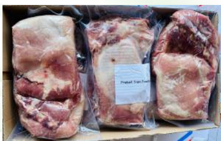
Sườn già nguyên miếng 豚スペアリブ