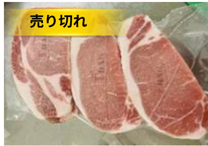
Cốt lết không xương cắt lát túi CK 豚ロース (骨なし) スライス