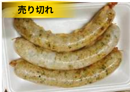
Dồi sụn chiên sẵn (~500g/khay)