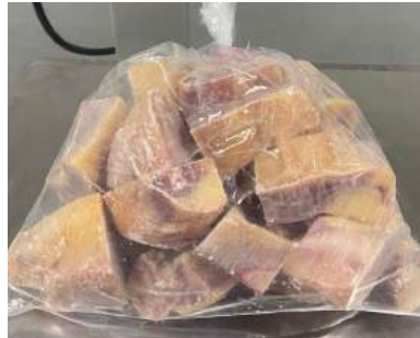
Gà dai loại ngon cắt sẵn nửa con (~1.2kg/con)