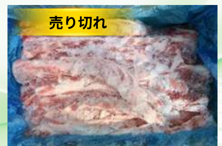
Sườn non nguyên thùng 豚軟骨