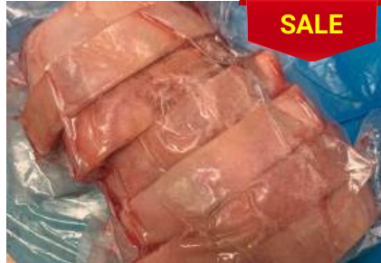
Bắp heo có da xương cắt khoanh - CK 皮・骨付き豚スネ (スライス)