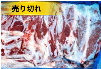
Bắp bò Úc loại 1 nguyên thùng 【オーストラリア産】牛スネ