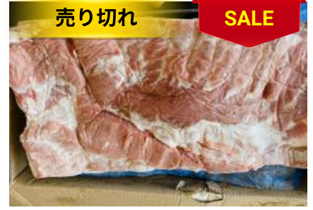
Ba chỉ không da nguyên tảng 豚バラ (皮・骨抜き)