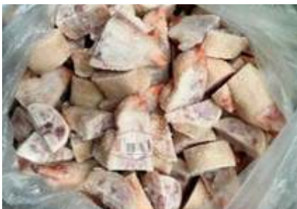
Móng heo cắt nhỏ chưa đóng túi 豚足 (六分カット)