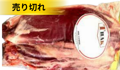
Bắp bò - Túi CK ~1kg 牛スネ