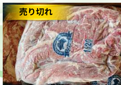
Điêm bò (harami/ sagari) 牛ハラミ