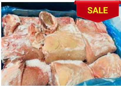
Bắp heo có da xương - Nguyên thùng 皮・骨付き豚スネ