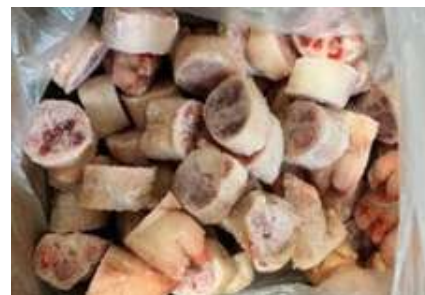
Móng heo cắt khoanh chưa đóng túi 豚足 (輪切)