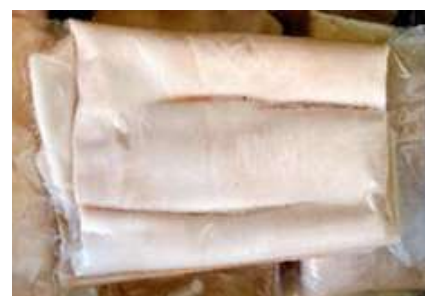
Da heo loại A túi CK ~ 1kg 豚足 (六分カット)