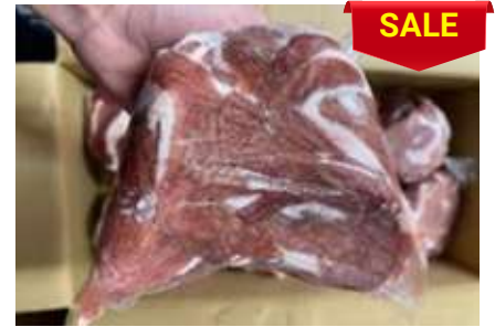
Lòng non sạch cứng túi thường 脂肪抜き豚小腸