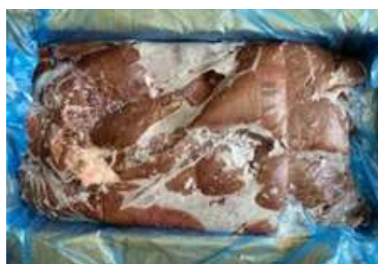
Gan heo nguyên thùng 豚レバー