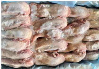
Lưỡi heo nguyên thùng 豚タン