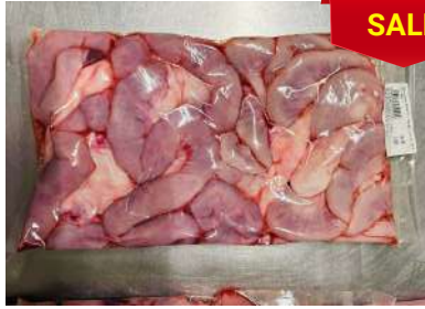
Dồi thường túi CK ~ 1kg 豚コブクロ