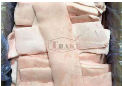
Mỡ heo nguyên thùng 豚脂肪