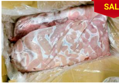
Dồi thường túi ~ 5kg 豚コブクロ