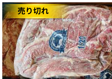
Điềm bò (harami/ sagari) 牛ハラミ