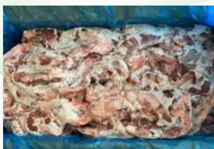
Điêm heo nguyên thùng 豚ハラミ