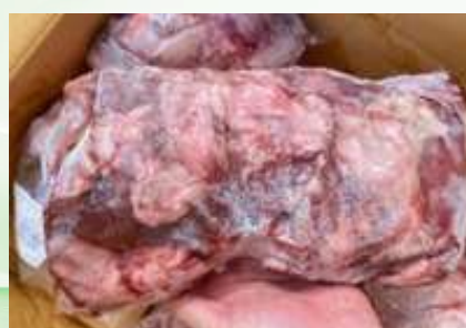
Điêm heo túi CK ~1kg 豚ハラミ