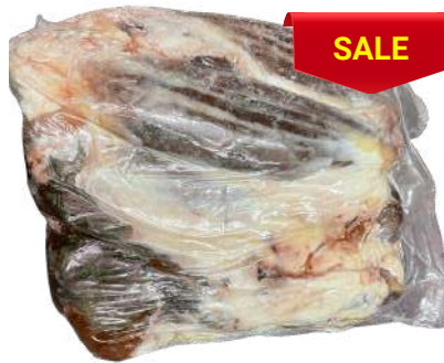
Bắp bò - Nguyên Bắp ~ 4kg シャンクミート