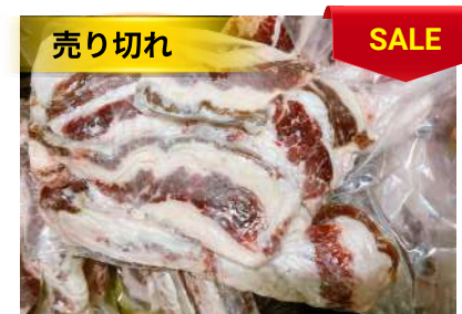
Ba chỉ bò - Túi CK 牛バラ