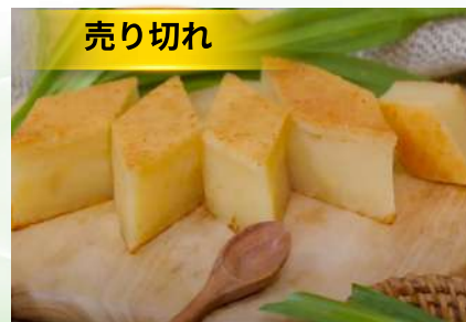
Bánh khoai mì nướng (túi 500g)