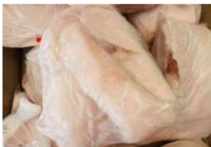
Mỡ heo túi thường ~1kg 豚脂肪