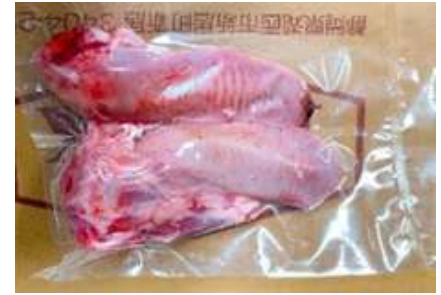
Lưỡi heo túi CK ~1kg 豚タン