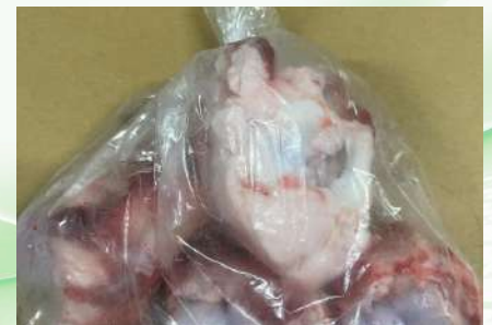
Xương ống bò cắt sẵn túi thường ~1kg 牛骨 (カット)