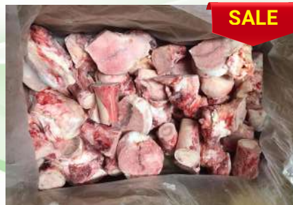
Xương ống bò cắt sẵn 牛骨 (カット)