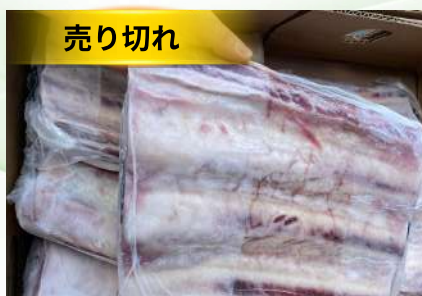
Sườn bò - Nguyên tảng 牛リブ