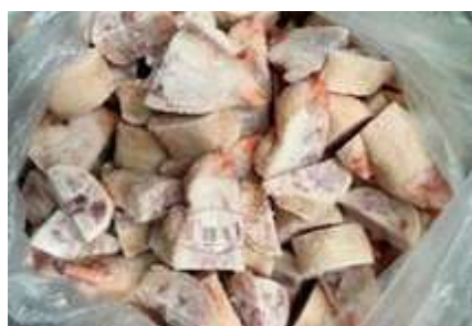
Móng heo cắt nhỏ chưa đóng túi 豚足 (六分カット)