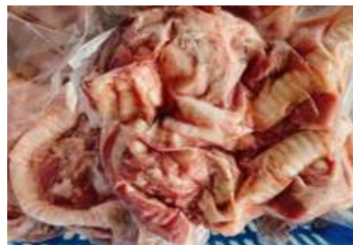
Cuống họng túi CK ~1kg 豚ノド