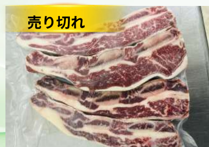
Sườn bò cắt ngang 2cm - Túi CK 牛リブ (カット)