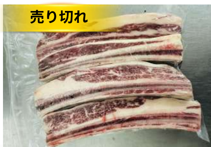
Sườn bò cắt dọc - Túi CK 牛リブ (カット)