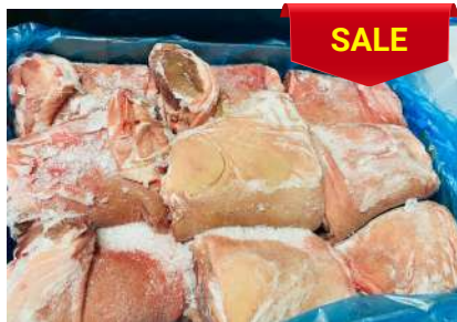
Bắp heo có da xương - Nguyên thùng 皮・骨付き豚スネ