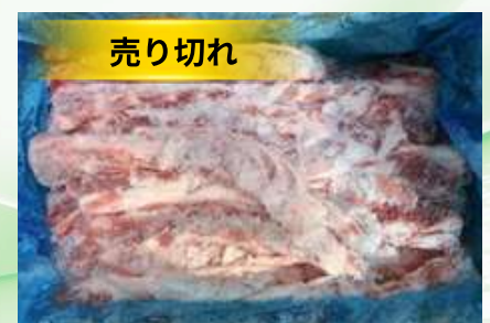
Sườn non nguyên thùng 豚軟骨