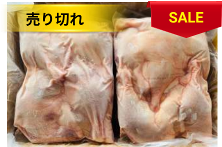
Đùi vịt (túi ~2kg) 骨付きアヒルモモ