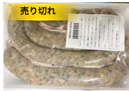
Dồi sụn sống (~400g/khay)