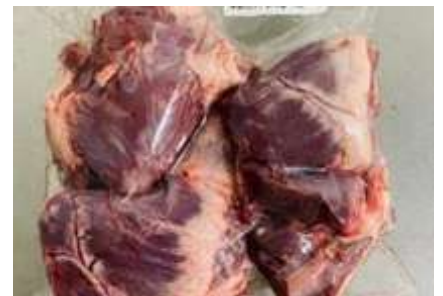
Tim heo túi CK ~1kg 豚ハツ