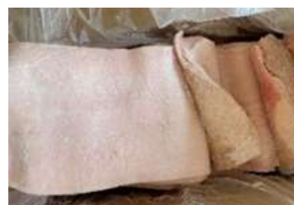
Da heo loại A nguyên thùng 豚皮