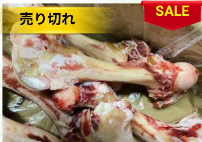
Xương ống bò chưa cắt 牛骨