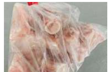
Xương ống heo túi thường ~1kg 豚骨 (カット)