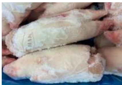
Móng heo nguyên cái nguyên thùng 豚足