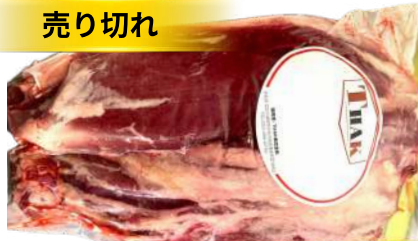
Bắp bò - Túi CK ~1kg 牛スネ