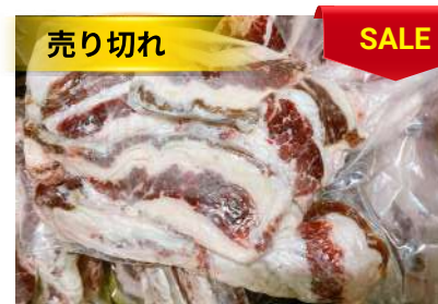
Ba chỉ bò - Túi CK 牛バラ