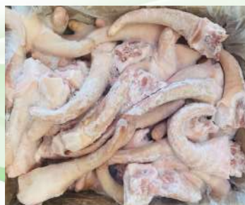
Đuôi heo nguyên thùng 豚テール