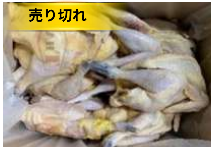
Gà chân đen Nagoya Cochin Kịch 18 con