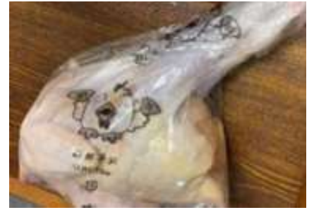
Gà dai loại ngon ~ 1,4kg Kịch 16 con