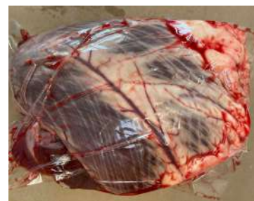
Tim bò - Túi CK ~1kg 牛ハツ (ぎゅうハツ)