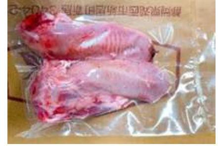
Lưỡi heo túi CK ~1kg 豚タン