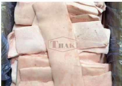
Mỡ heo nguyên thùng 豚脂肪