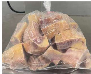
Gà dai loại ngon cắt sẵn nửa con (~1.2kg/con)