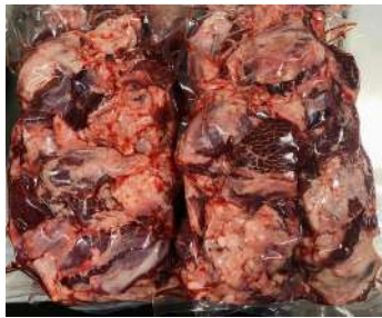
Thịt đầu bò - Túi CK ~1kg ぎゅうとうにく