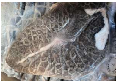
Tổ ong bò đen 牛ハチノス (黒)