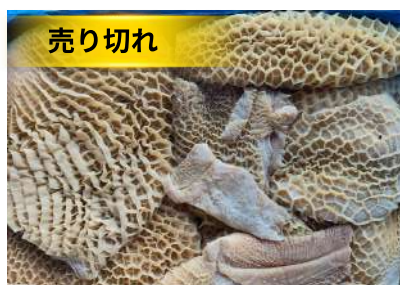
Tổ ong bò làm sạch - Nguyên thùng 牛ハチノス