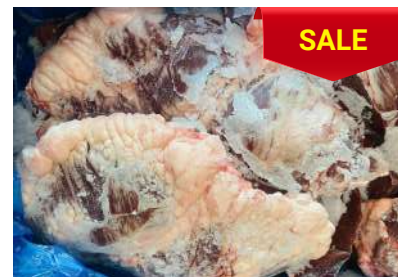
Tim bò nguyên thùng 牛ハツ (ぎゅうハツ)