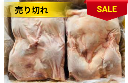
Đùi vịt (túi ~2kg) 骨付きアヒルモモ