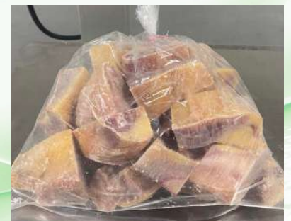
Gà dai loại ngon cắt sẵn nửa con (~1.4kg/con)