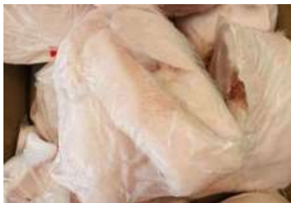
Mỡ heo túi thường ~1kg 豚脂肪