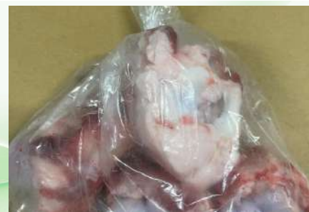
Xương ống bò cắt sẵn túi thường ~1kg 牛骨 (カット)