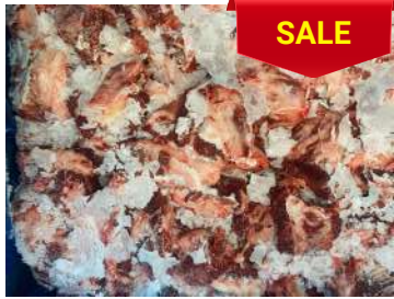
Thịt đầu bò nguyên thùng ぎゅうとうにく