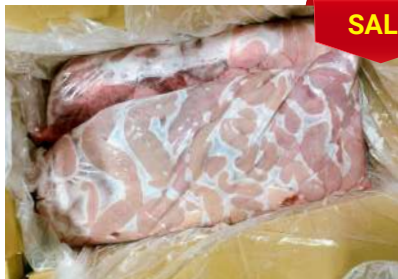
Dồi thường túi ~ 5kg 豚コブクロ