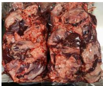
Thịt đầu bò - Túi CK ~1kg ぎゅうとうにく