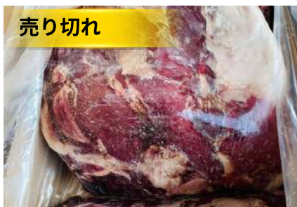
Nạc mông bò Úc 【オーストラリア産】牛ウチモモ