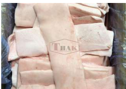
Mỡ heo nguyên thùng 豚脂肪