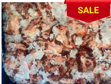
Thịt đầu bò nguyên thùng ぎゅうとうにく