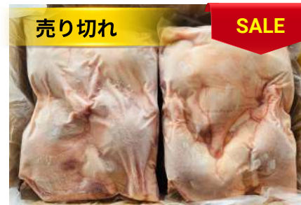
Đùi vịt (túi ~2kg) 骨付きアヒルモモ