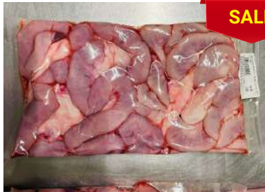
Dồi thường túi CK ~ 1kg 豚コブクロ