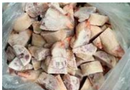
Móng heo cắt nhỏ chưa đóng túi 豚足 (六分カット)