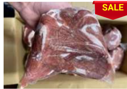
Lòng non sạch cứng túi thường 脂肪抜き豚小腸