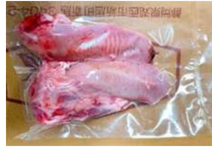
Lưỡi heo túi CK ~1kg 豚タン