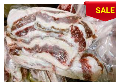
Ba chỉ bò - Túi CK 牛バラ