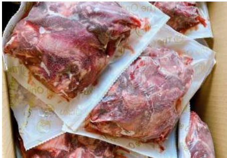
Gân bò có thịt túi 500g 肉付き牛すじ