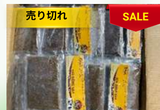
Cua đồng xay 200g/túi カニのピューレ