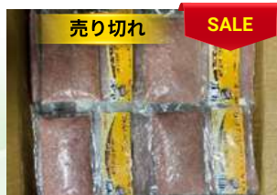
Chả cá thác lát 200g/túi ナイフィッシュのすり身