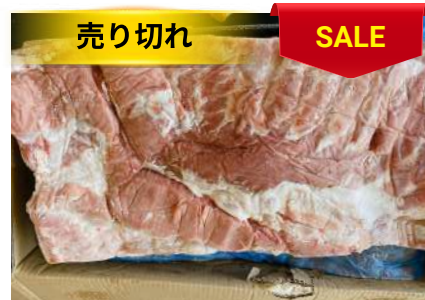
Ba chỉ không da nguyên tảng 豚バラ (皮・骨抜き)