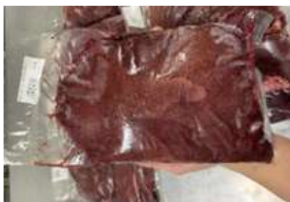
Gan heo túi CK ~1kg 豚レバー