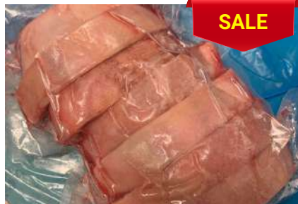
Bắp heo có da xương cắt khoanh - CK 皮・骨付き豚スネ (スライス)