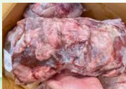
Điêm heo túi CK ~1kg 豚ハラミ