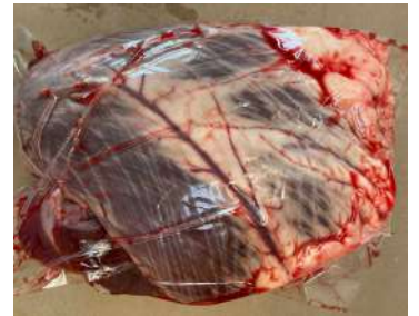
Tim bò - Túi CK ~1kg 牛ハツ (ぎゅうハツ)