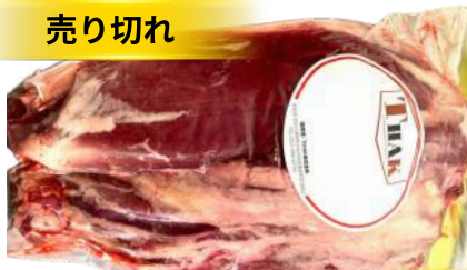
Bắp bò - Túi CK ~1kg 牛スネ