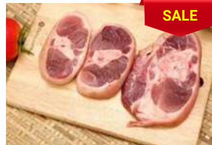
Bắp heo có da xương cắt khoanh 皮・骨付き豚スネ (スライス)