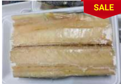
Cá thu phi lê đóng khay さわらフィレー