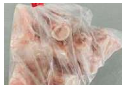
Xương ống heo túi thường ~1kg 豚骨 (カット)