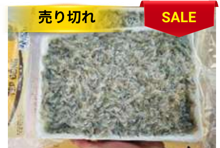
Tép đồng 450g/khay 小エビ