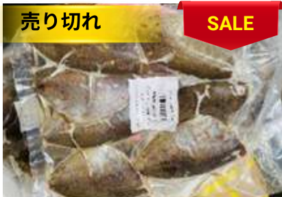
Cá giò biển ướp muối ớt túi ~ 500g