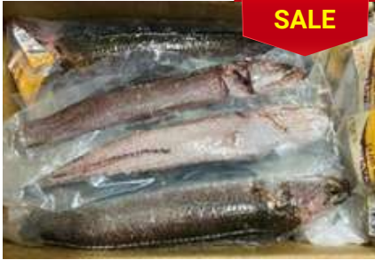
Cá lóc làm sạch nguyên con (có đầu) ライギョ魚