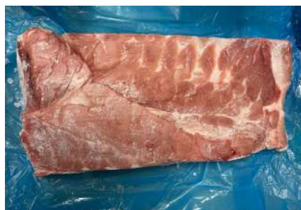
Ba chỉ da nguyên tảng 皮付き豚バラ (骨なし)