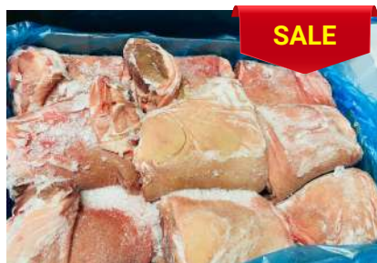
Bắp heo có da xương - Nguyên thùng 皮・骨付き豚スネ