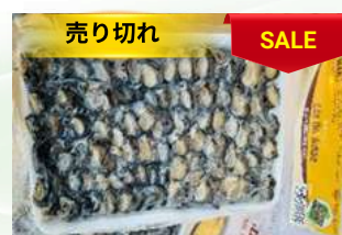
Cò ốc bươu 450g/khay カタツムリ