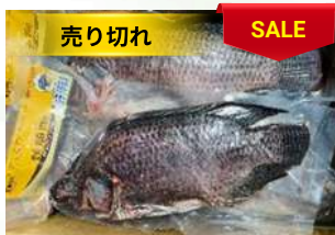
Cá rô phi nguyên con ティラピア魚