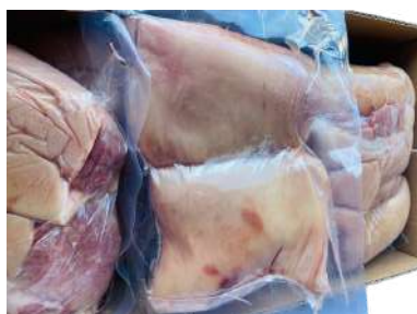
Bắp heo RÚT XƯƠNG túi CK 皮付き豚スネ (骨なし)