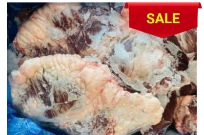
Tim bò nguyên thùng 牛ハツ (ぎゅうハツ)