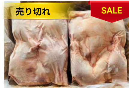
Đùi vịt (túi ~2kg) 骨付きアヒルモモ