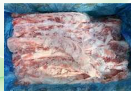
Sườn non nguyên thùng 豚軟骨