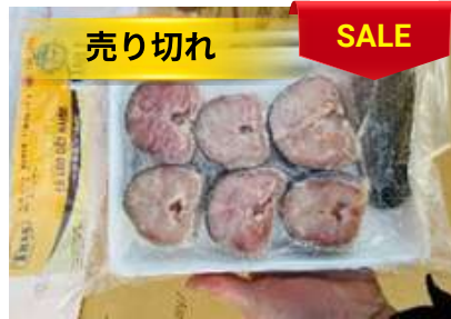
Cá lóc cắt khúc 450g/khay ライギョ魚カット