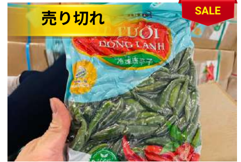
Ớt Xanh đông lạnh 500g/túi