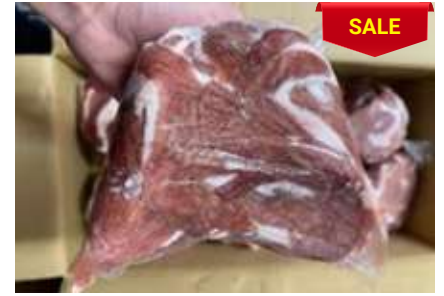
Lòng non sạch cứng túi thường 脂肪抜き豚小腸