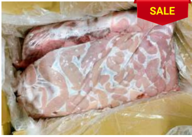
Dồi thường túi ~ 5kg 豚コブクロ