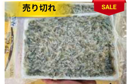
Tép đồng 450g/khay 小エビ