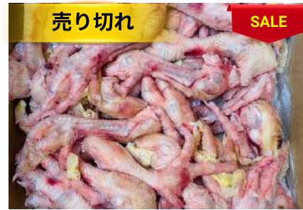
Chân gà dài nguyên thùng 鶏モミジ