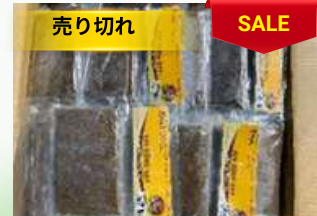
Cua đồng xay 200g/túi カニのピューレ