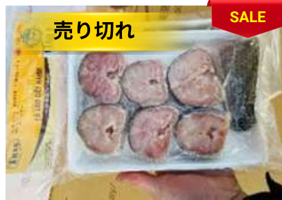
Cá lóc cắt khúc 450g/khay ライギョ魚カット