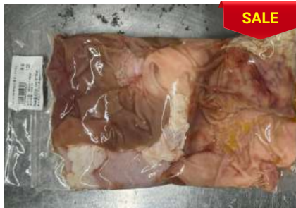
Bao tử túi CK 1~1,5kg 豚ガツ