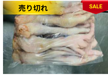
Chân gà dài túi thường ~1kg 鶏モミジ