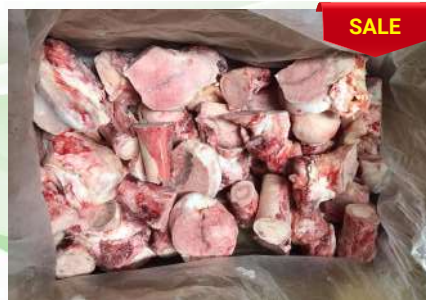
Xương ống bò cắt sẵn 牛骨 (カット)