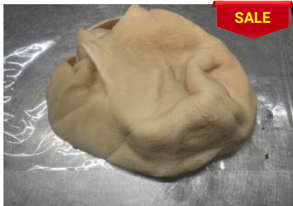
Tổ ong/ Sách dê ヤギの胃腸