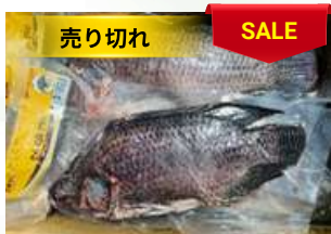
Cá rô phi nguyên con ティラピア魚