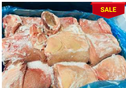
Bắp heo có da xương - Nguyên thùng 皮・骨付き豚スネ