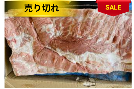
Ba chỉ không da nguyên tảng 豚バラ (皮・骨抜き)