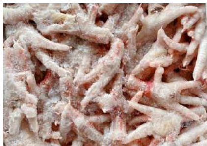
Chân gà ngắn nguyên thùng 鶏ショートモミジ