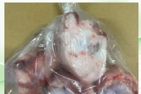
Xương ống bò cắt sẵn túi thường ~1kg 牛骨 (カット)