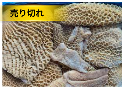
Tổ ong bò làm sạch - Nguyên thùng 牛ハチノス