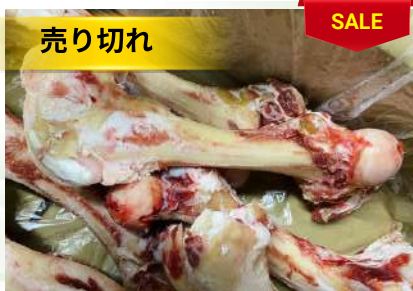
Xương ống bò chưa cắt 牛骨