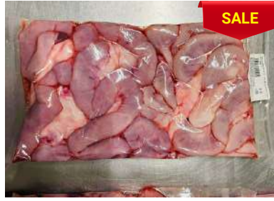
Dồi thường túi CK ~ 1kg 豚コブクロ