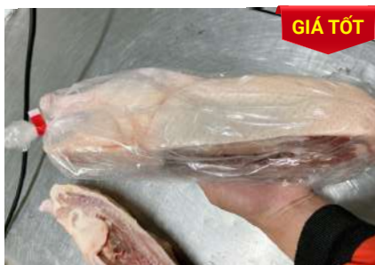
Vịt CP nửa con アヒル (ダック)