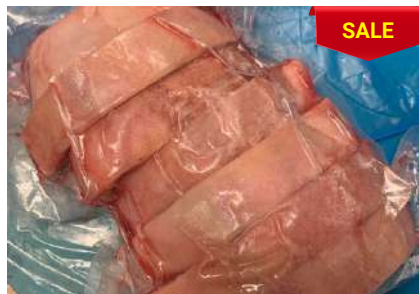
Bắp heo có da xương cắt khoanh - CK 皮・骨付き豚スネ (スライス)