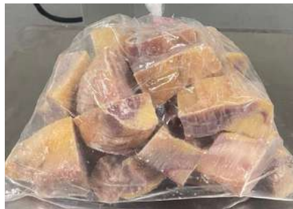
Gà dai loại ngon cắt sẵn nguyên con (~1kg/con)