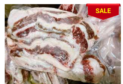
Ba chỉ bò - Túi CK 牛バラ