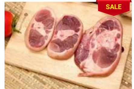
Bắp heo có da xương cắt khoanh 皮・骨付き豚スネ (スライス)