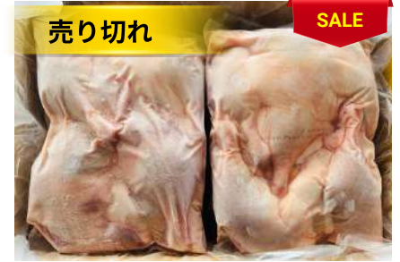
Đùi vịt (túi ~2kg) 骨付きアヒルモモ