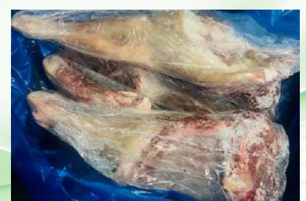
Đùi Dê nguyên thùng ヤギモモ