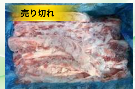
Sườn non nguyên thùng 豚軟骨