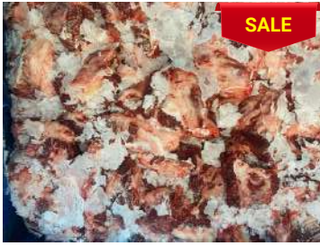
Thịt đầu bò nguyên thùng ぎゅうとうにく