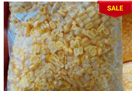
Bắp ngọt bào sẵn túi 500g Phù hợp nấu súp, chè...