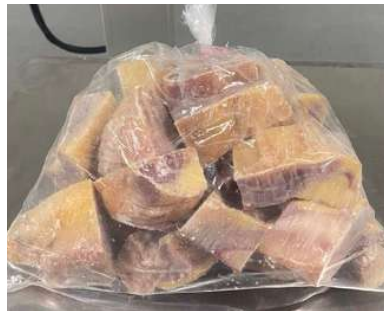
Gà dai loại ngon cắt sẵn nửa con (~1.2kg/con)