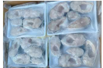
Cá ba sa cắt khúc 500g/khay バス魚 カット