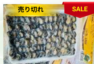
Cò ốc bươu 450g/khay カタツムリ