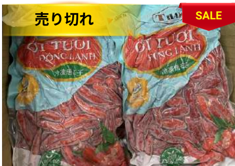
Ớt tươi đông lạnh 250g/túi