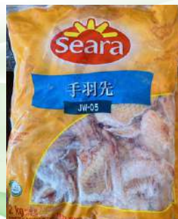
Cánh gà nguyên thùng 鶏手羽