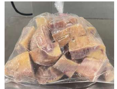
Gà dai loại ngon cắt sẵn nửa con (~1kg/con)