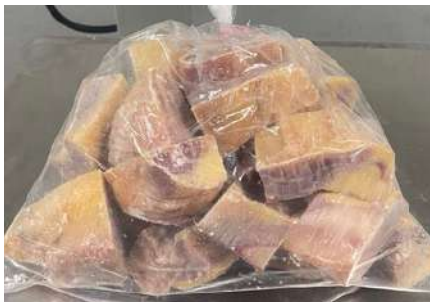
Gà dai loại ngon cắt sẵn nguyên con (~1.2kg/con)