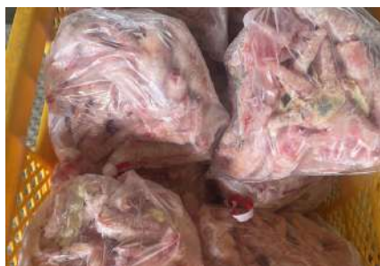
Chân gà ngắn túi thường ~1kg 鶏ショートモミジ