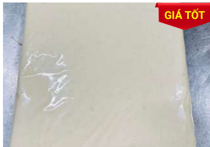
Khoai mì xay sẵn túi 1kg 冷凍挽きキャッサバ