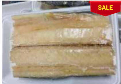
Cá thu phi lê đóng khay さわらフィレー