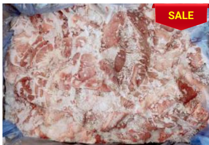
Bao tử nguyên thùng 豚ガツ