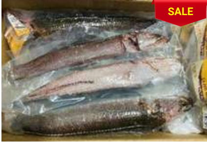
Cá lóc làm sạch nguyên con (có đầu) ライギョ魚