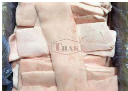
Mỡ heo nguyên thùng 豚脂肪