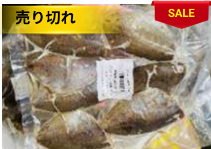
Cá giò biển ướp muối ớt túi ~ 500g