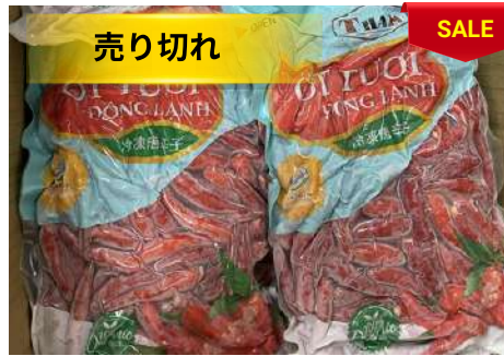
Ớt đỏ đông lạnh 500g/túi