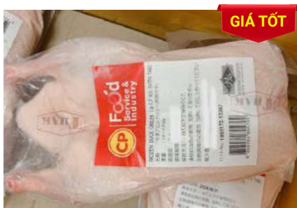
Vịt CP 1,6~1,7kg アヒル (ダック)