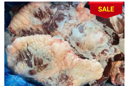
Tim bò nguyên thùng 牛ハツ (ぎゅうハツ)