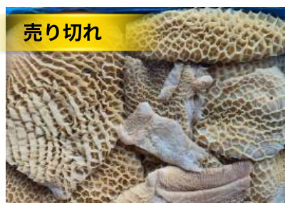
Tổ ong bò làm sạch - Nguyên thùng 牛ハチノス