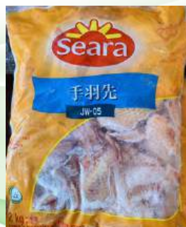
Cánh gà nguyên thùng 鶏手羽