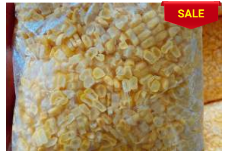
Bắp ngọt bào sẵn túi 500g Phù hợp nấu súp, chè...