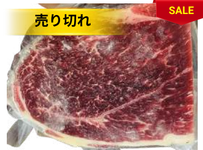
Nạm gầu bò - Túi CK ~ 1KG クロッド