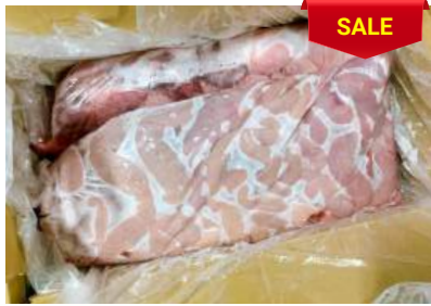
Dồi thường túi ~ 5kg 豚コブクロ