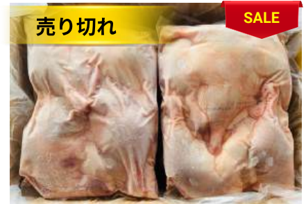
Đùi vịt (túi ~2kg) 骨付きアヒルモモ