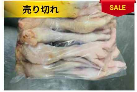
Chân gà dài túi thường ~1kg 鶏モミジ