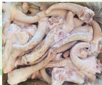
Đuôi heo nguyên thùng 豚テール