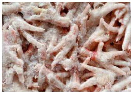
Chân gà ngắn nguyên thùng 鶏ショートモミジ