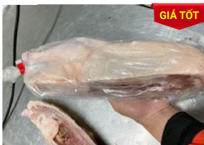
Vịt CP nửa con アヒル (ダック)