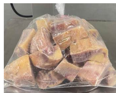
Gà dai loại ngon cắt sẵn nửa con (~1kg/con)