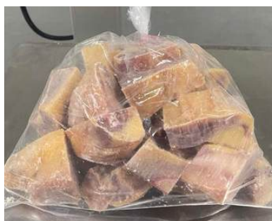
Gà dai loại ngon cắt sẵn nửa con (~1.2kg/con)