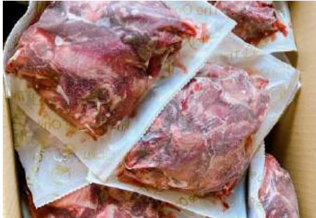
Gân bò có thịt túi 500g 肉付き牛すじ