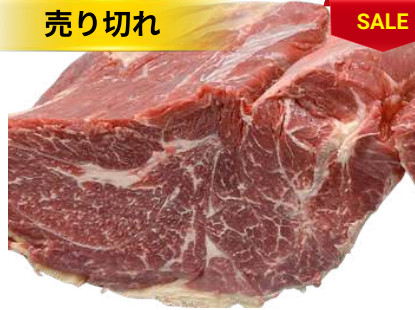
Nạm gầu bò nguyên tảng クロッド