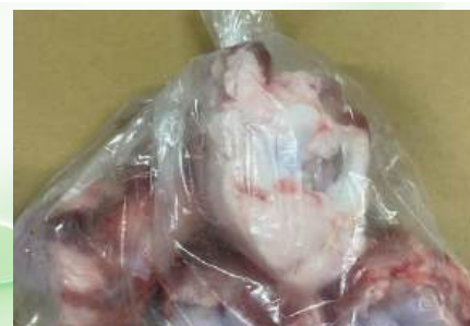
Xương ống bò cắt sẵn túi thường ~1kg 牛骨 (カット)