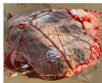
Tim bò - Túi CK ~1kg 牛ハツ (ぎゅうハツ)