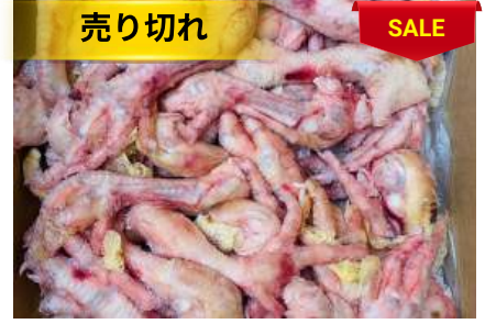
Chân gà dài nguyên thùng 鶏モミジ