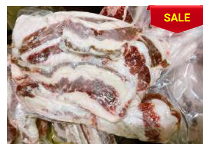
Ba chỉ bò - Túi CK 牛バラ