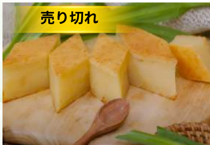
Bánh khoai mì nướng (túi 1kg)