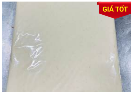
Khoai mì xay sẵn túi 1kg 冷凍挽きキャッサバ