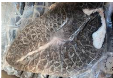
Tổ ong bò đen 牛ハチノス (黒)