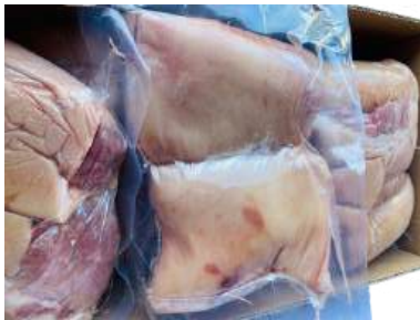
Bắp heo RÚT XƯƠNG túi CK 皮付き豚スネ (骨なし)