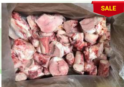
Xương ống bò cắt sẵn 牛骨 (カット)