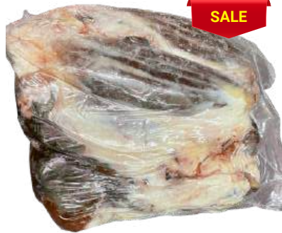
Bắp bò - Nguyên Bắp ~ 4kg シャンクミート