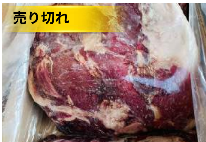
Nạc mông bò Úc 【オーストラリア産】牛ウチモモ