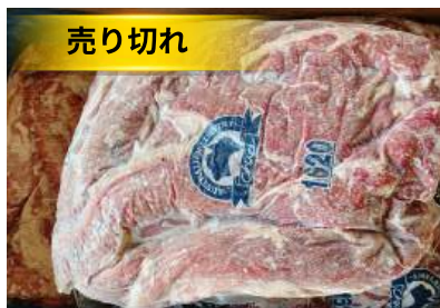
Điềm bò (harami/ sagari) 牛ハラミ