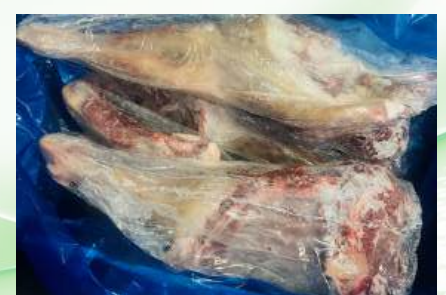
Đùi Dê nguyên thùng ヤギモモ