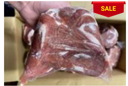
Lòng non sạch cứng túi thường 脂肪抜き豚小腸