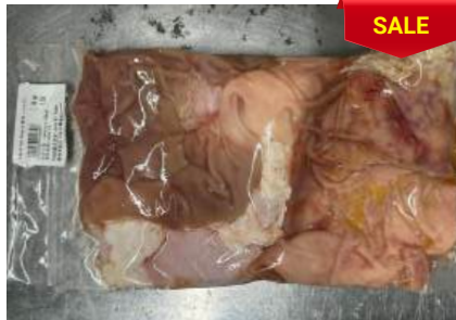
Bao tử túi CK 1~1,5kg 豚ガツ