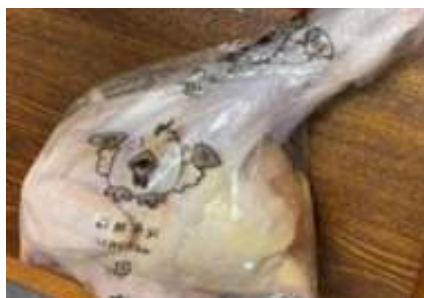
Gà dai loại ngon ~ 1,2kg Kịch 20 con