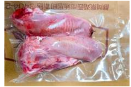
Lưỡi heo túi CK ~1kg 豚タン