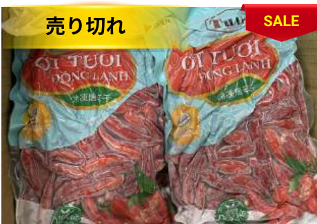
Ớt tươi đông lạnh 250g/túi