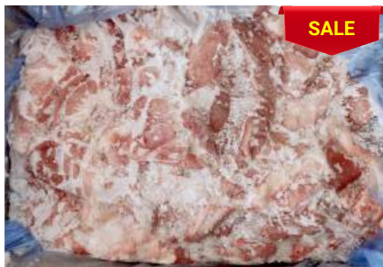
Bao tử nguyên thùng 豚ガツ