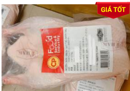
Vịt CP 1,6~1,7kg アヒル (ダック)