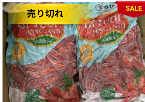
Ớt đỏ đông lạnh 500g/túi