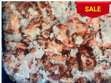
Thịt đầu bò nguyên thùng ぎゅうとうにく