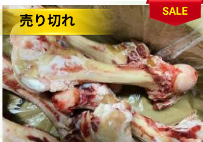
Xương ống bò chưa cắt 牛骨