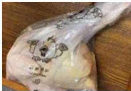
Gà dai loại ngon ~ 1kg Kịch 26 con