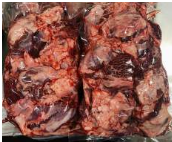
Thịt đầu bò - Túi CK ~1kg ぎゅうとうにく