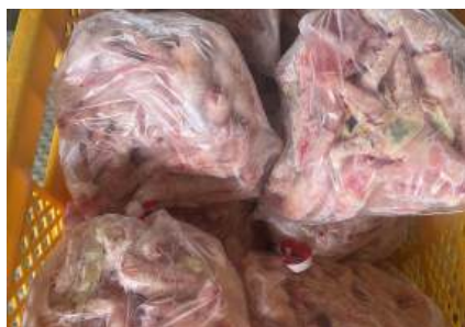
Chân gà ngắn túi thường ~1kg 鶏ショートモミジ