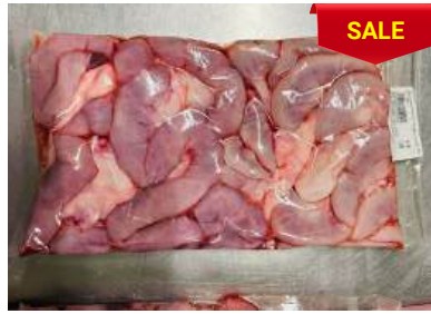
Dồi thường túi CK ~ 1kg 豚コブクロ