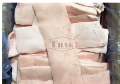
Mỡ heo nguyên thùng 豚脂肪