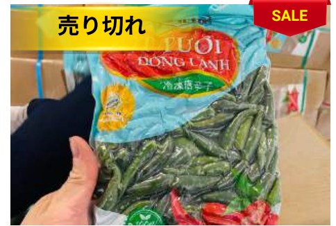
Ớt Xanh đông lạnh 500g/túi