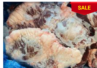
Tim bò nguyên thùng 牛ハツ (ぎゅうハツ)