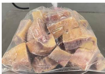
Gà dai loại ngon cắt sẵn nguyên con (~1kg/con)