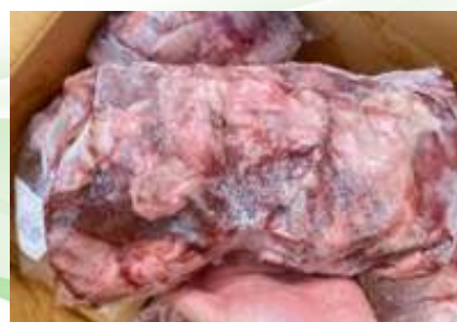
Điêm heo túi CK ~1kg 豚ハラミ