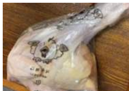
Gà dai loại ngon ~ 1,4kg Kịch 16 con