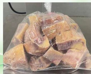
Gà dai loại ngon cắt sẵn nửa con (~1.4kg/con)