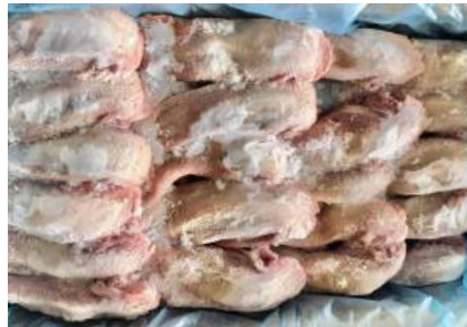
Lưỡi heo nguyên thùng 豚タン