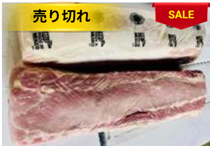
Cốt lết không xương nguyên tảng 豚ロース (骨なし)