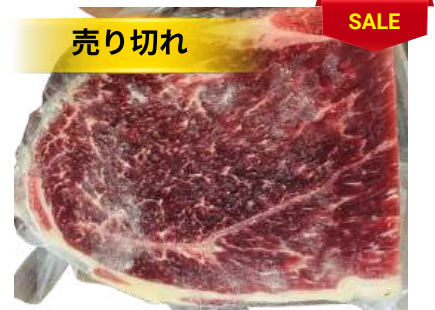
Nạm gầu bò - Túi CK ~ 1KG クロッド