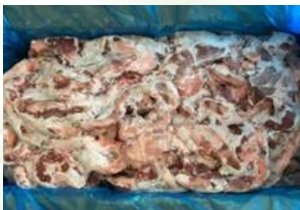
Điêm heo nguyên thùng 豚ハラミ