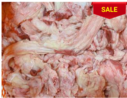
Gân mỡ bắp bò - CK ~1kg 牛すね肉のスジと脂