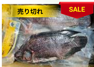
Cá rô phi nguyên con ティラピア魚