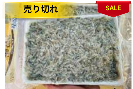
Tép đồng 450g/khay 小エビ