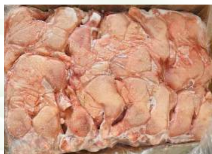
Đùi gà nguyên thùng 鶏モモ