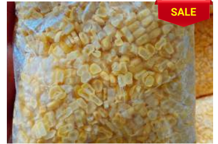
Bắp ngọt bào sẵn túi 500g Phù hợp nấu súp, chè...