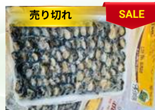
Cò ốc bươu 450g/khay カタツムリ