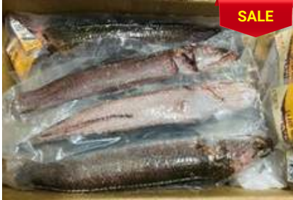
Cá lóc làm sạch nguyên con (có đầu) ライギョ魚