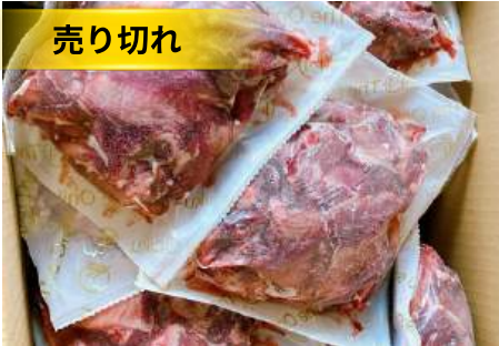
Gân bò có thịt túi 500g 肉付き牛すじ