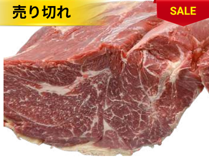
Nạm gầu bò nguyên tảng クロッド