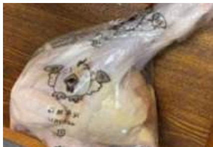
Gà dai loại ngon ~ 1kg Kịch 26 con