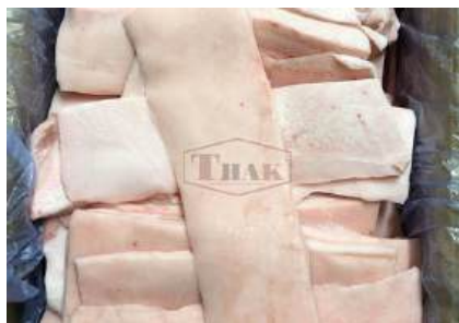
Mỡ heo nguyên thùng 豚脂肪