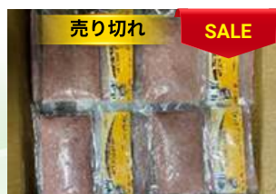
Chả cá thác lát 200g/túi ナイフフィッシュのすり身