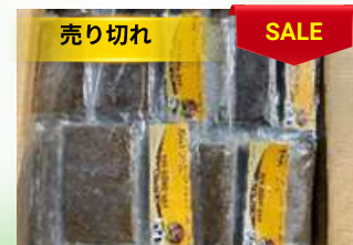
Cua đồng xay 200g/túi カニのピューレ