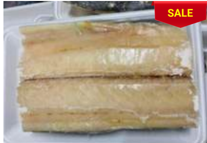
Cá thu phi lê đóng khay さわらフィレー