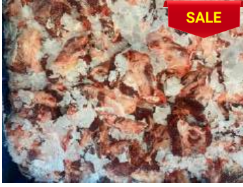
Thịt đầu bò nguyên thùng ぎゅうとうにく