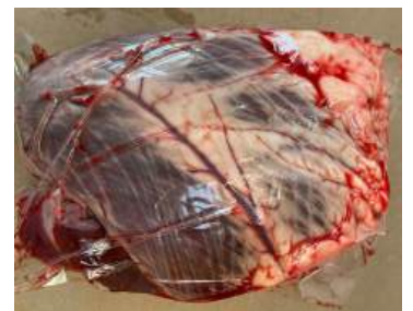
Tim bò - Túi CK ~1kg 牛ハツ (ぎゅうハツ)