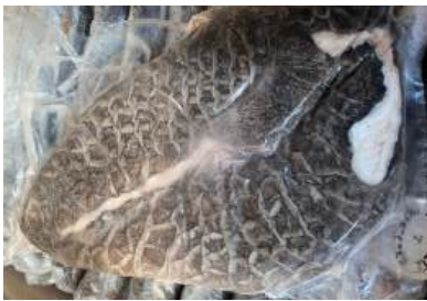
Tổ ong bò đen 牛ハチノス (黒)