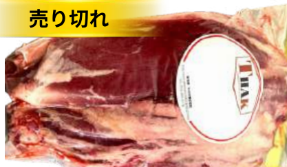
Bắp bò - Túi CK ~1kg 牛スネ