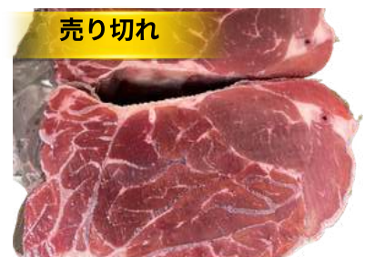
Bắp bò - LỖI HOA 牛スネ(選択品)