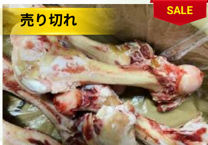
Xương ống bò chưa cắt 牛骨