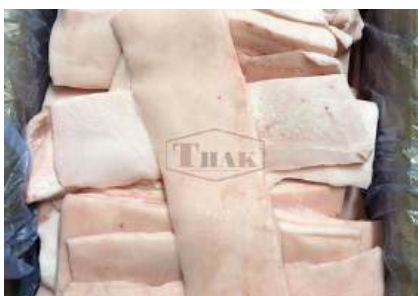
Mỡ heo nguyên thùng 豚脂肪