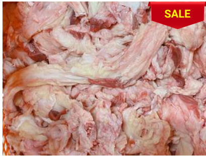
Gân mỡ bắp bò - CK ~1kg 牛すね肉のスジと脂