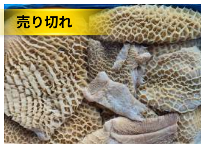
Tổ ong bò làm sạch - Nguyên thùng 牛ハチノス