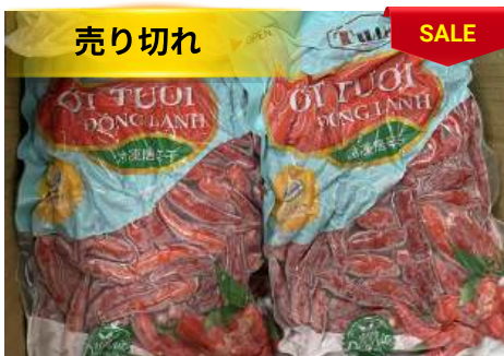
Ớt tươi đông lạnh 250g/túi