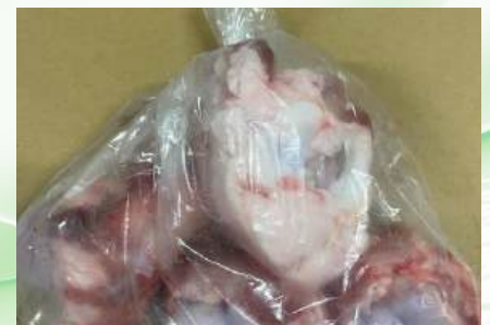
Xương ống bò cắt sẵn túi thường ~1kg 牛骨 (カット)