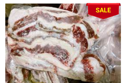
Ba chỉ bò - Túi CK 牛バラ