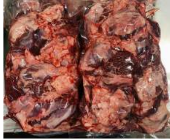
Thịt đầu bò - Túi CK ~1kg ぎゅうとうにく