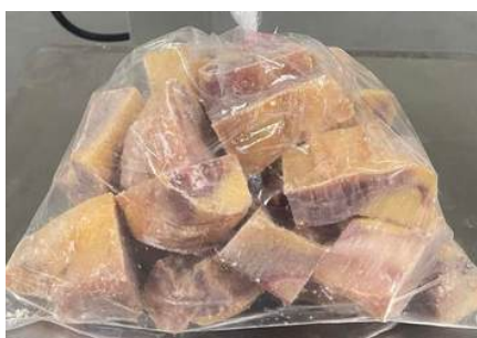
Gà dai loại ngon cắt sẵn nguyên con (~1.2kg/con)