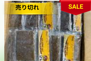
Cua đồng xay 200g/túi カニのピューレ