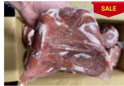
Lòng non sạch cứng túi thường 脂肪抜き豚小腸