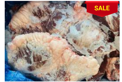
Tim bò nguyên thùng 牛ハツ (ぎゅうハツ)