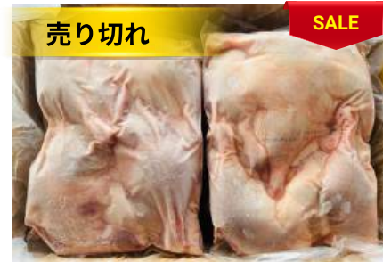
Đùi vịt (túi ~2kg) 骨付きアヒルモモ