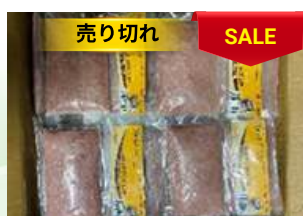
Chả cá thát lát 200g/túi ナイフフィッシュのすり身