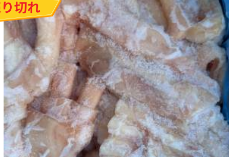
Gân bò trắng nguyên thùng 骨付きアヒルモモ