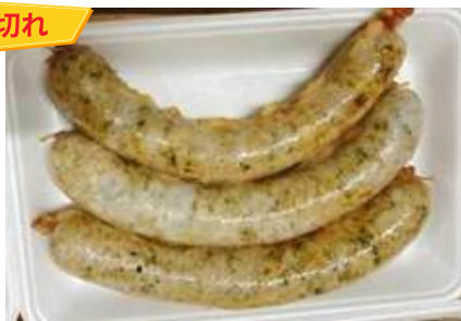
Dồi sụn chiên sẵn (~500g/khay)