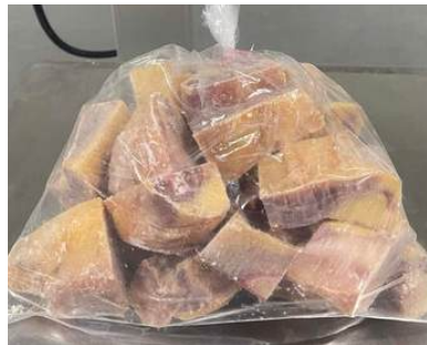
Gà dai loại ngon cắt sẵn nửa con (~1.2kg/con)