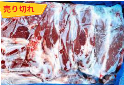
Bắp bò Úc loại 1 nguyên thùng 【オーストラリア産】牛スネ