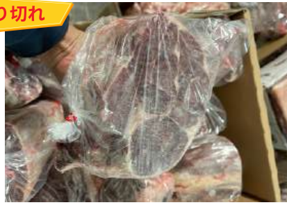
Bắp bò Hà Lan - Cắt, túi thường 【ポーランド産】牛スネ