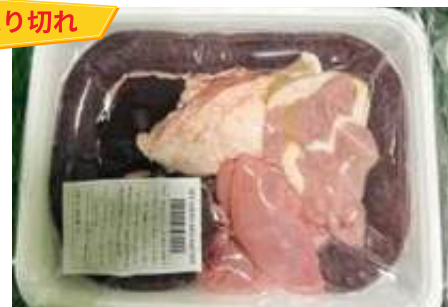
Set lòng dôi sống (~500g/khay)