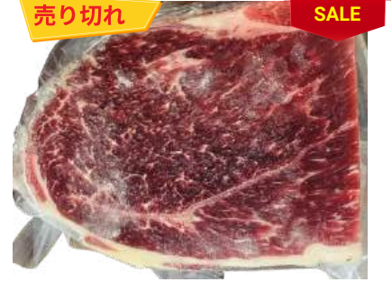
Nạm gầu bò - Túi CK ~ 1KG クロッド