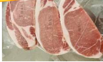
Cốt lết không xương cắt lát túi CK 豚ロース (骨なし) スライス