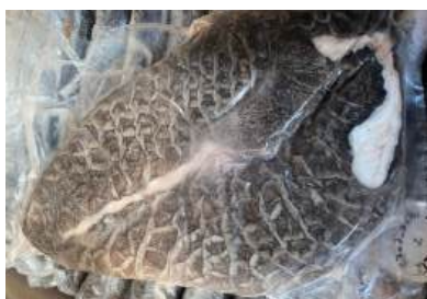
Tổ ong bò đen 牛ハチノス (黒)