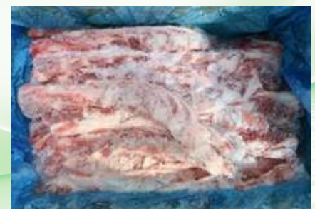
Sườn non nguyên thùng 豚軟骨