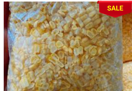
Bắp ngọt bào sẵn túi 500g Phù hợp nấu súp, chè...