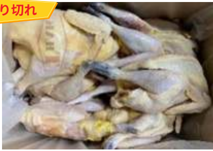
Gà chân đen Nagoya Cochin Kịch 18 con