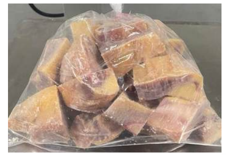
Gà dai loại ngon cắt sẵn nguyên con (~1.4kg/con)