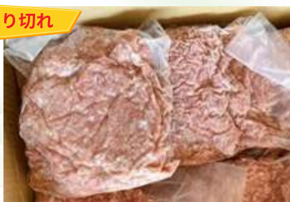
Thịt heo xay 豚ミンチ