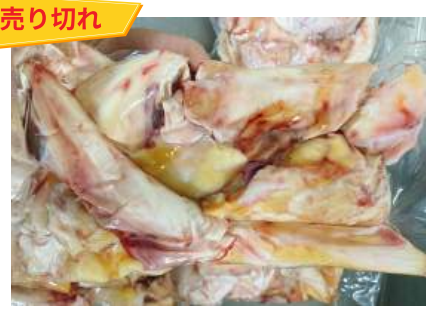
Gân bắp bò - Túi CK ~1kg 牛アキレス腱