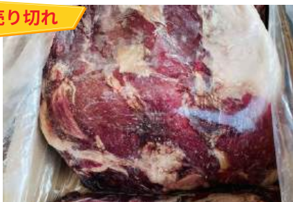
Nạc mông bò Úc 【オーストラリア産】牛ウチモモ