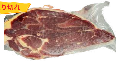
Bắp bò - Túi CK ~ 1kg 牛スネ