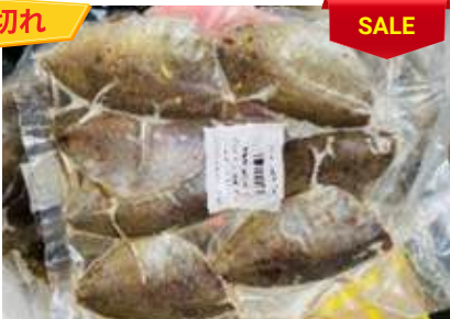
Cá giò biển ướp muối ớt túi ~ 500g