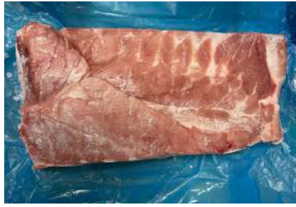
Ba chỉ da nguyên tảng 皮付き豚バラ (骨なし)