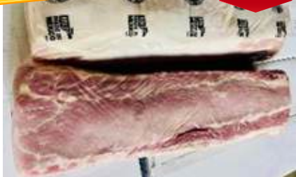
Cốt lết không xương nguyên tảng 豚ロース (骨なし)