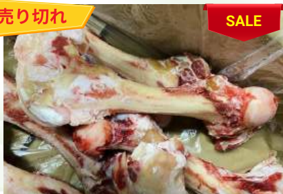
Xương ống bò chưa cắt 牛骨