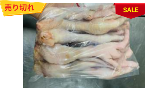
Chân gà dài túi thường ~1kg 鶏モミジ