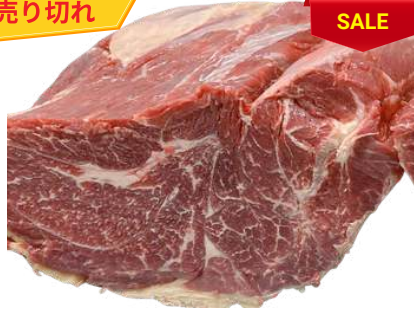
Nạm gầu bò nguyên tảng クロッド