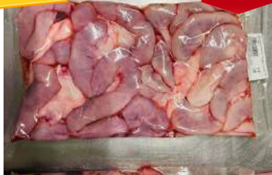
Dồi thường túi CK ~ 1kg 豚コブクロ