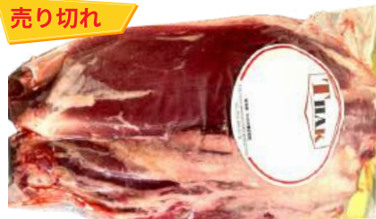
Bắp bò - Túi CK ~ 1kg 牛スネ