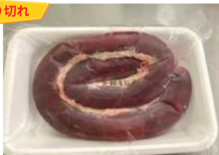
Lòng tiết (400~500g/khay)