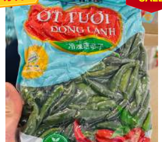
Ớt Xanh đông lạnh 500g/túi