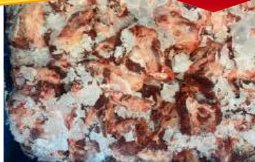
Thịt đầu bò nguyên thùng ぎゅうとうにく