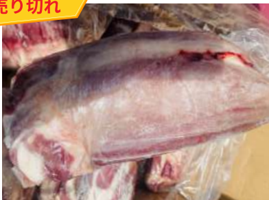
Bắp bò Hà Lan - Nguyên bắp 【ポーランド産】牛スネ