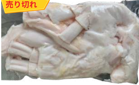
Gân bò trắng - Túi CK ~1kg 牛アキレス