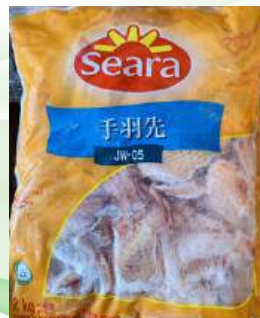
Cánh gà nguyên thùng 鶏手羽