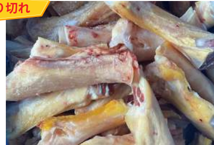
Gân bắp bò nguyên thùng 牛アキレス腱