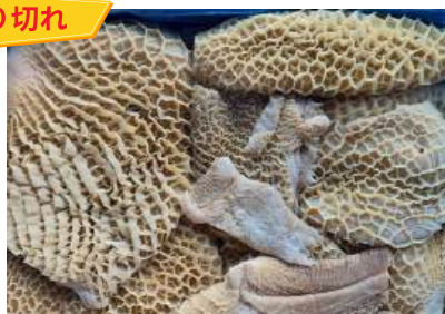
Tổ ong bò làm sạch - Nguyên thùng 牛ハチノス