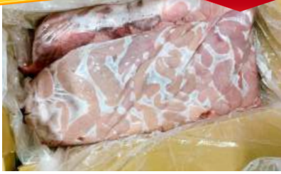
Dồi thường túi ~ 5kg 豚コブクロ