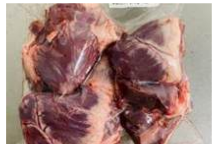
Tim heo túi CK ~1kg 豚ハツ