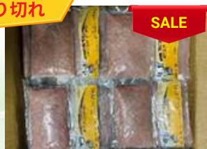
Chả cá thác lát 200g/túi ナイフフィッシュのすり身