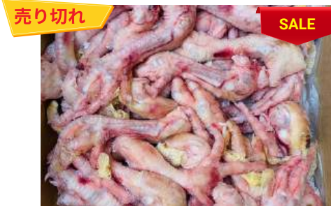
Chân gà dài nguyên thùng 鶏モミジ