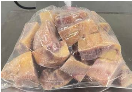
Gà dai loại ngon cắt sẵn nguyên con (~1.2kg/con)