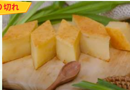
Bánh khoai mì nướng (túi 500g)