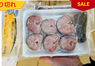
Cá lóc cắt khúc 450g/khay ライギョ魚カット