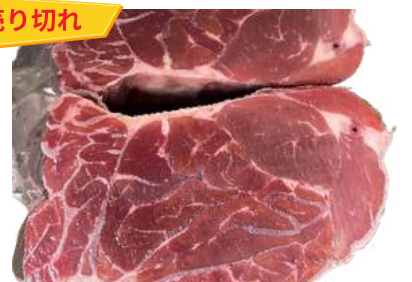
Bắp bò - LÔI HOA 牛スネ(選択品)