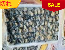
Cò ọc bươu 450g/khay カタツムリ