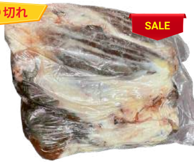
Bắp bò - Nguyên Bắp ~ 4kg シャンクミート