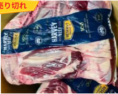
Bắp bò Úc - Nguyên Bắp AUST産 シャンクミート