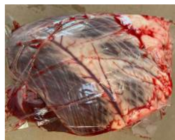
Tim bò - Túi CK ~1kg 牛ハツ (ぎゅうハツ)