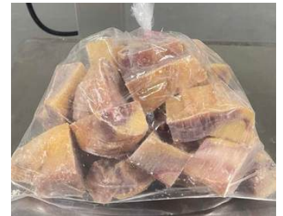
Gà dai loại ngon cắt sẵn nửa con (~1kg/con)