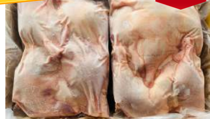
Đùi vịt (túi ~2kg) 骨付きアヒルモモ