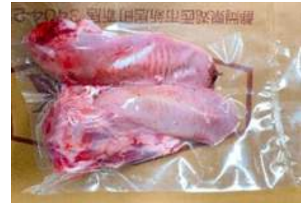
Lưỡi heo túi CK ~1kg 豚タン