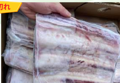
Sườn bò - Nguyên tảng 牛リブ