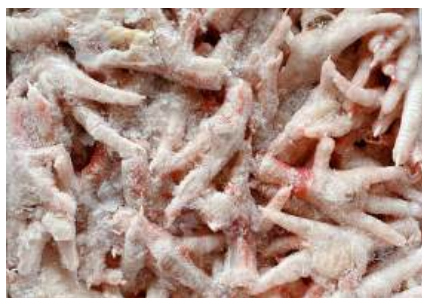
Chân gà ngắn nguyên thùng 鶏ショートモミジ