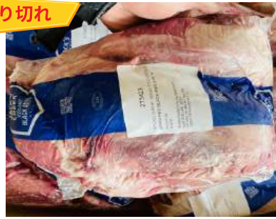
Bắp bò XANH (Úc) - Nguyên bắp 【オーストラリア産】牛スネ