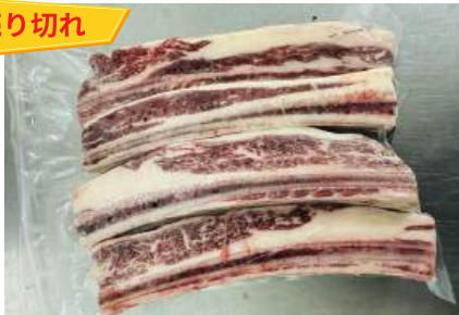
Sườn bò cắt dọc - Túi CK 牛リブ (カット)