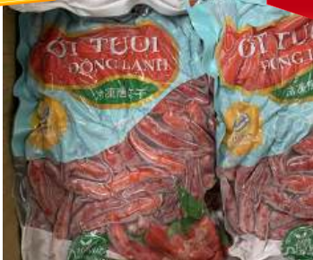
Ớt tươi đông lạnh 250g/túi