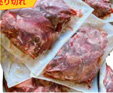
Gân bò có thịt túi 500g 肉付き牛すじ