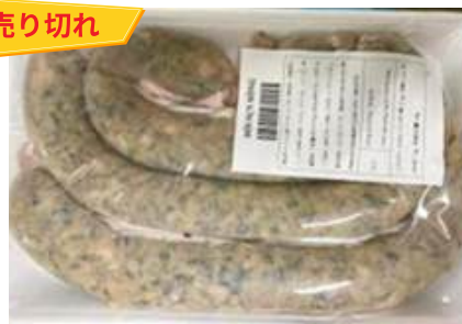
Dồi sụn sống (~400g/khay)