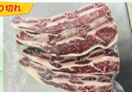
Sườn bò cắt ngang 2cm - Túi CK 牛リブ (カット)