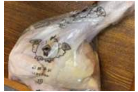
Gà dai loại ngon ~ 1,4kg Kịch 16 con