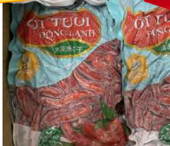
Ớt đỏ đông lạnh 500g/túi