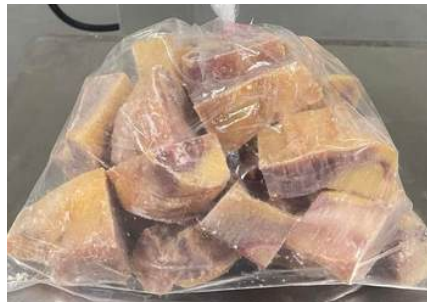
Gà dai loại ngon cắt sẵn nguyên con (~1kg/con)