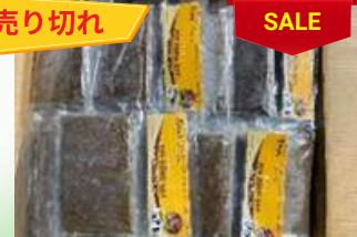
Cua đồng xay 200g/túi カニのピューレ