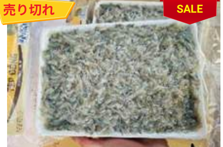
Tép đồng 450g/khay 小エビ