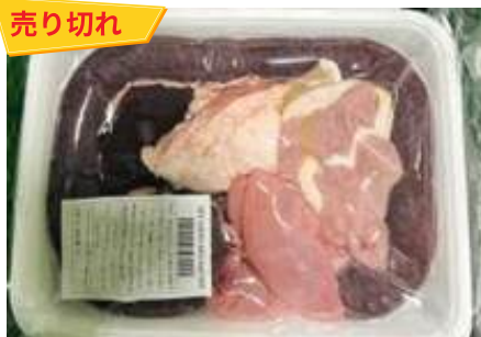
Set lòng dôi sống (~1kg/khay)