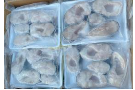
Cá ba sa cắt khúc 500g/khay バス魚 カット