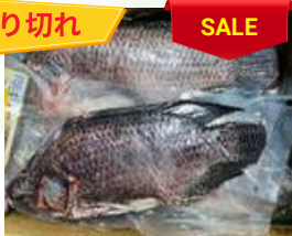
Cá rô phi nguyên con ティラピア魚