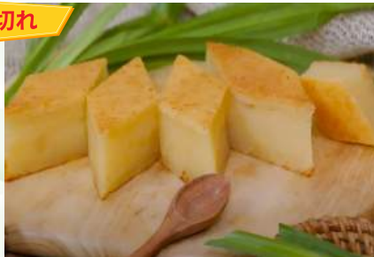
Bánh khoai mì nướng (túi 1kg)