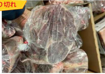
Bắp bò Hà Lan - Cắt, túi thường 【ポーランド産】牛スネ