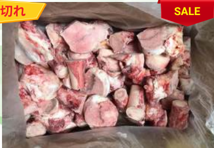
Xương ống bò cắt sẵn 牛骨 (カット)