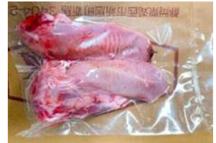
Lưỡi heo túi CK ~1kg 豚タン