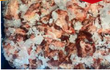
Thịt đầu bò nguyên thùng ぎゅうとうにく