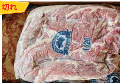
Điềm bò (harami/ sagari) 牛ハラミ