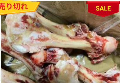
Xương ống bò chưa cắt 牛骨