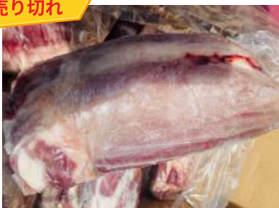
Bắp bò Hà Lan - Nguyên bắp 【ポーランド産】牛スネ