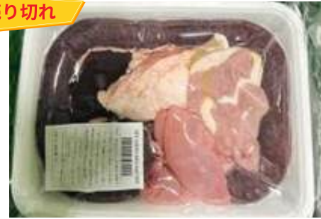
Set lòng dôi sống (~500g/khay)