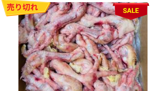
Chân gà dài nguyên thùng 鶏モミジ