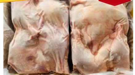
Đùi vịt (túi ~2kg) 骨付きアヒルモモ