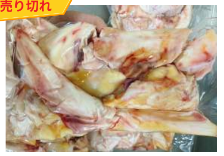
Gân bắp bò - Túi CK ~1kg 牛アキレス腱