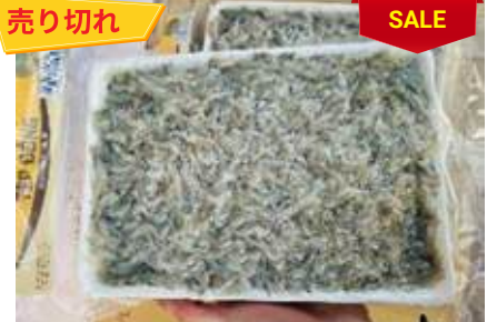
Tép đồng 450g/khay 小エビ