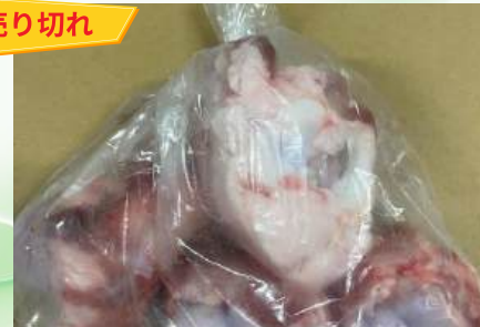
Xương ống bò cắt sẵn túi thường ~1kg 牛骨 (カット)