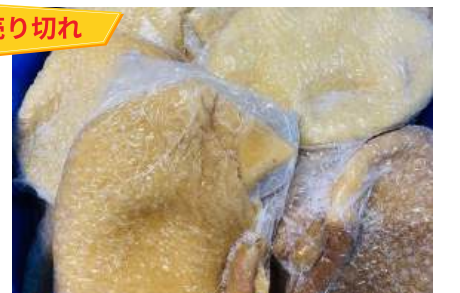
Tổ ong bò làm sạch - Túi CK ~1kg 牛ハチノス