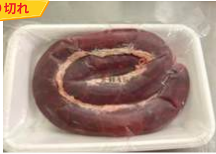
Lòng tiết (400~500g/khay)