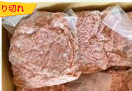
Thịt heo xay 豚ミンチ