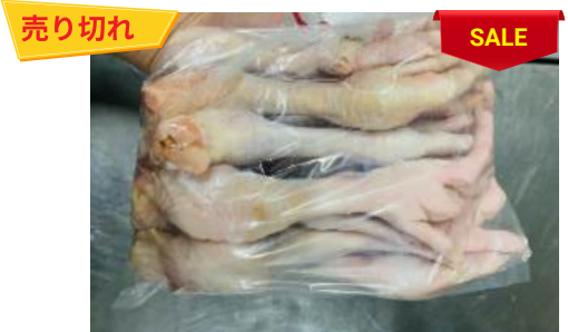
Chân gà dài túi thường ~1kg 鶏モミジ