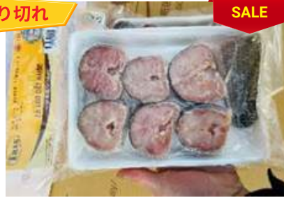
Cá lóc cắt khúc 450g/khay ライギョ魚カット