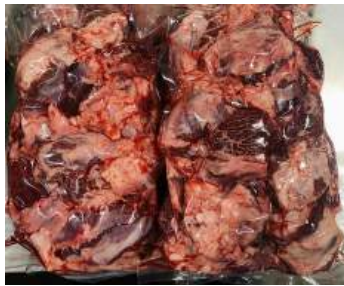
Thịt đầu bò - Túi CK ~1kg ぎゅうとうにく