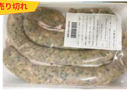
Dồi sụn sống (~400g/khay)