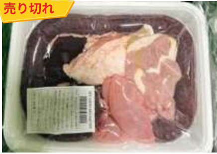
Set lòng dôi sống (~1kg/khay)