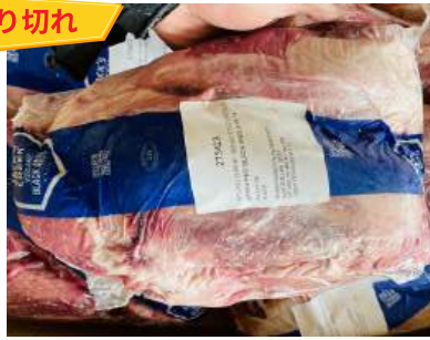
Bắp bò XANH (Úc) - Nguyên bắp 【オーストラリア産】牛スネ