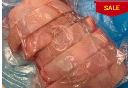
Bắp heo có da xương cắt khoanh - CK 皮・骨付き豚スネ (スライス)