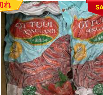
Ớt tươi đông lạnh 250g/túi