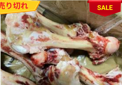
Xương ống bò chưa cắt 牛骨