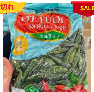
Ớt Xanh đông lạnh 500g/túi