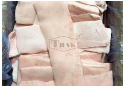
Mỡ heo nguyên thùng 豚脂肪