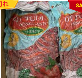
Ớt đỏ đông lạnh 500g/túi