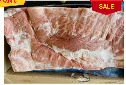
Ba chỉ không da nguyên tảng 豚バラ (皮・骨抜き)