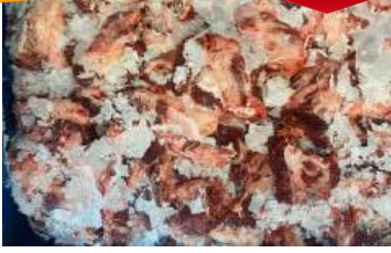
Thịt đầu bò nguyên thùng ぎゅうとうにく