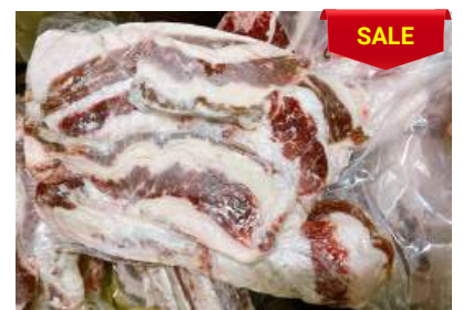
Ba chỉ bò - Túi CK 牛バラ