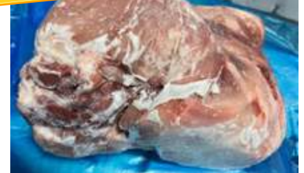
Mông heo có da nguyên tảng 豚モモ 皮付き