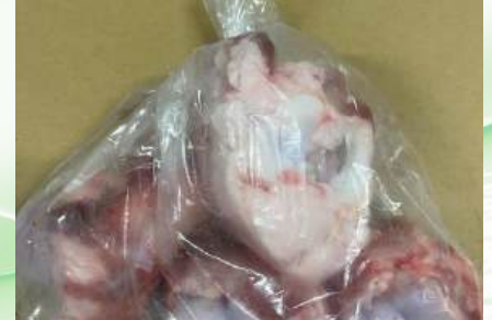
Xương ống bò cắt sẵn túi thường ~1kg 牛骨 (カット)