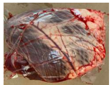
Tim bò - Túi CK ~1kg 牛ハツ (ぎゅうハツ)