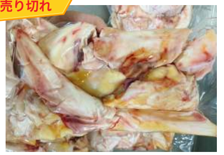
Gân bắp bò - Túi CK ~1kg 牛アキレス腱