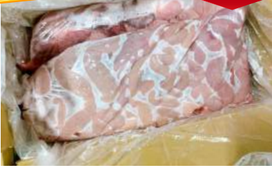
Dồi thường túi ~ 5kg 豚コブクロ