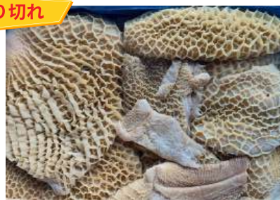
Tổ ong bò làm sạch - Nguyên thùng 牛ハチノス