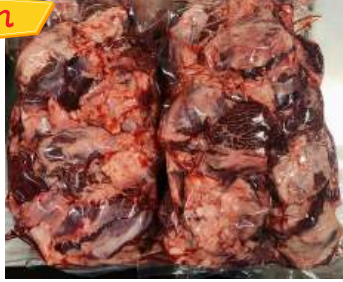
Thịt đầu bò - Túi CK ~1kg ぎゅうとうにく