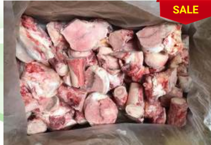
Xương ống bò cắt sẵn 牛骨 (カット)