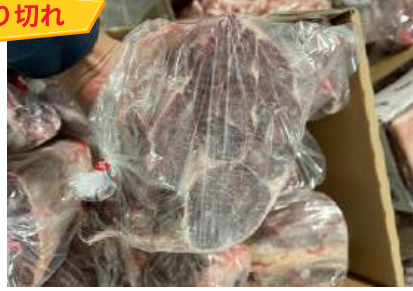
Bắp bò Hà Lan - Cắt, túi thường 【ポーランド産】牛スネ