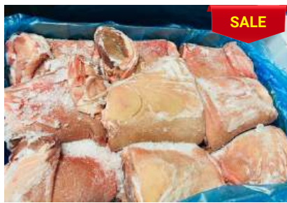
Bắp heo có da xương - Nguyên thùng 皮・骨付き豚スネ