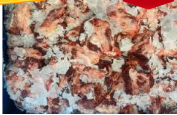
Thịt đầu bò nguyên thùng ぎゅうとうにく