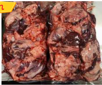
Thịt đầu bò - Túi CK ~1kg ぎゅうとうにく