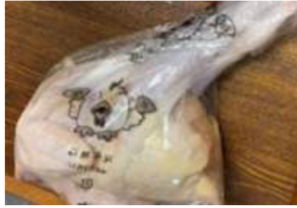
Gà dai loại ngon ~ 1,2kg Kịch 20 con