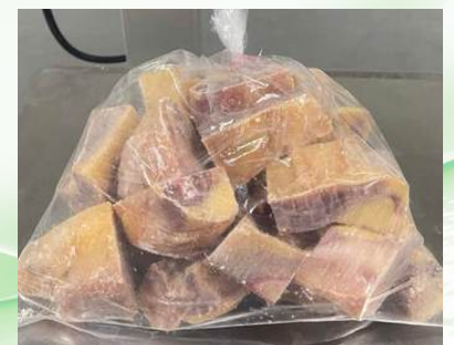
Gà dai loại ngon cắt sẵn nửa con (~1.4kg/con)