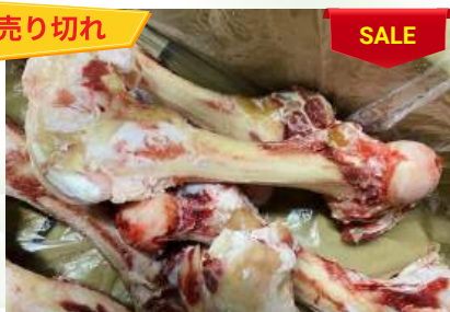
Xương ống bò chưa cắt 牛骨