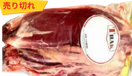
Bắp bò - Túi CK ~1kg 牛スネ