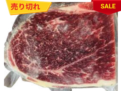
Nạm gầu bò - Túi CK ~ 1KG クロッド