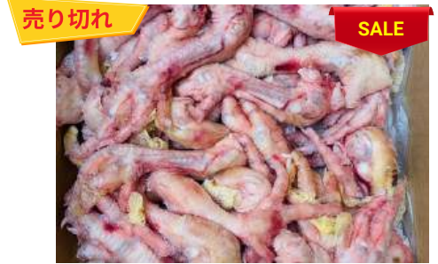
Chân gà dài nguyên thùng 鶏モミジ