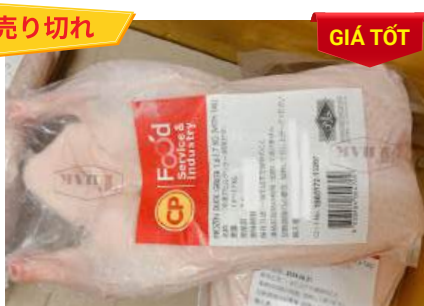
Vịt CP 1,6~1,7kg アヒル (ダック)