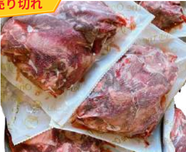
Gân bò có thịt túi 500g 肉付き牛すじ