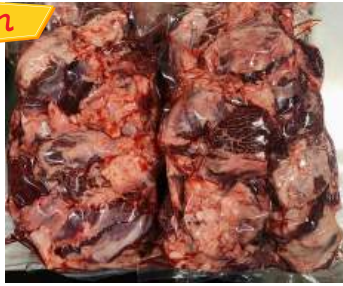
Thịt đầu bò - Túi CK ~1kg ぎゅうとうにく