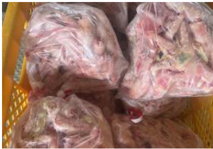
Chân gà ngắn túi thường ~1kg 鶏ショートモミジ