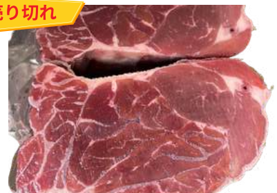
Bắp bò - LỖI HOA 牛スネ(選択品)