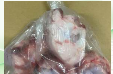
Xương ống bò cắt sẵn túi thường ~1kg 牛骨 (カット)