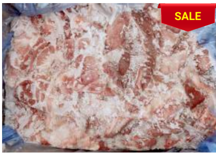
Bao tử nguyên thùng 豚ガツ