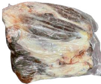
Bắp bò - Nguyên Bắp ~ 4kg シャンクミート