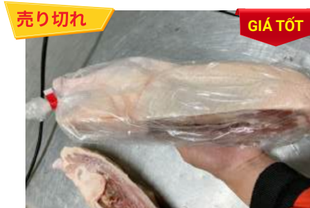
Vịt CP nửa con アヒル (ダック)