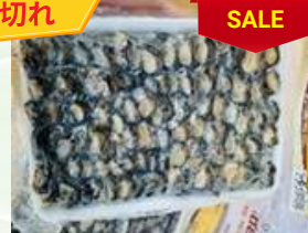
Cò ọc bươu 450g/khay カタツムリ