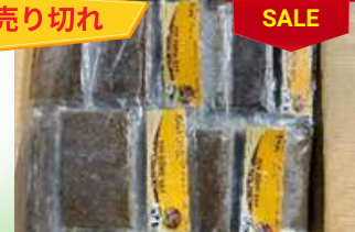
Cua đồng xay 200g/túi カニのピューレ