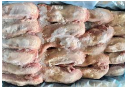
Lưỡi heo nguyên thùng 豚タン