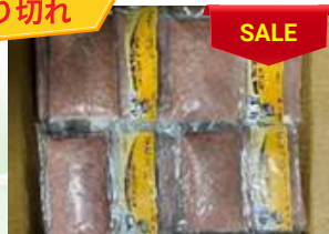
Chả cá thác lát 200g/túi ナイフフィッシュのすり身