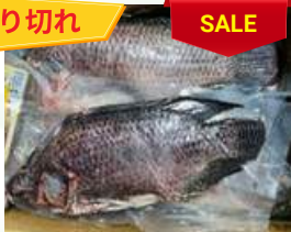
Cá rô phi nguyên con ティラピア魚