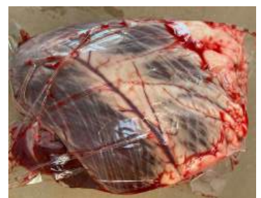
Tim bò - Túi CK ~1kg 牛ハツ (ぎゅうハツ)